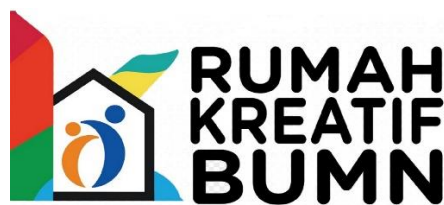
Gambar II.1 Logo Rumah Kreatif BUMN

Rumah Kreatif BUMN Bandung memiliki logo, logo yang digunakan dapat ditemui di website perusahaan dan di dalam surat menyurat perusahaan.