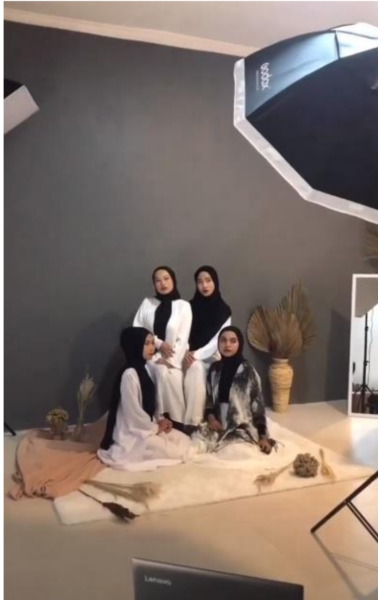
Gambar II. 12 Keadaan Studio Saat Melakukan Pemotretan