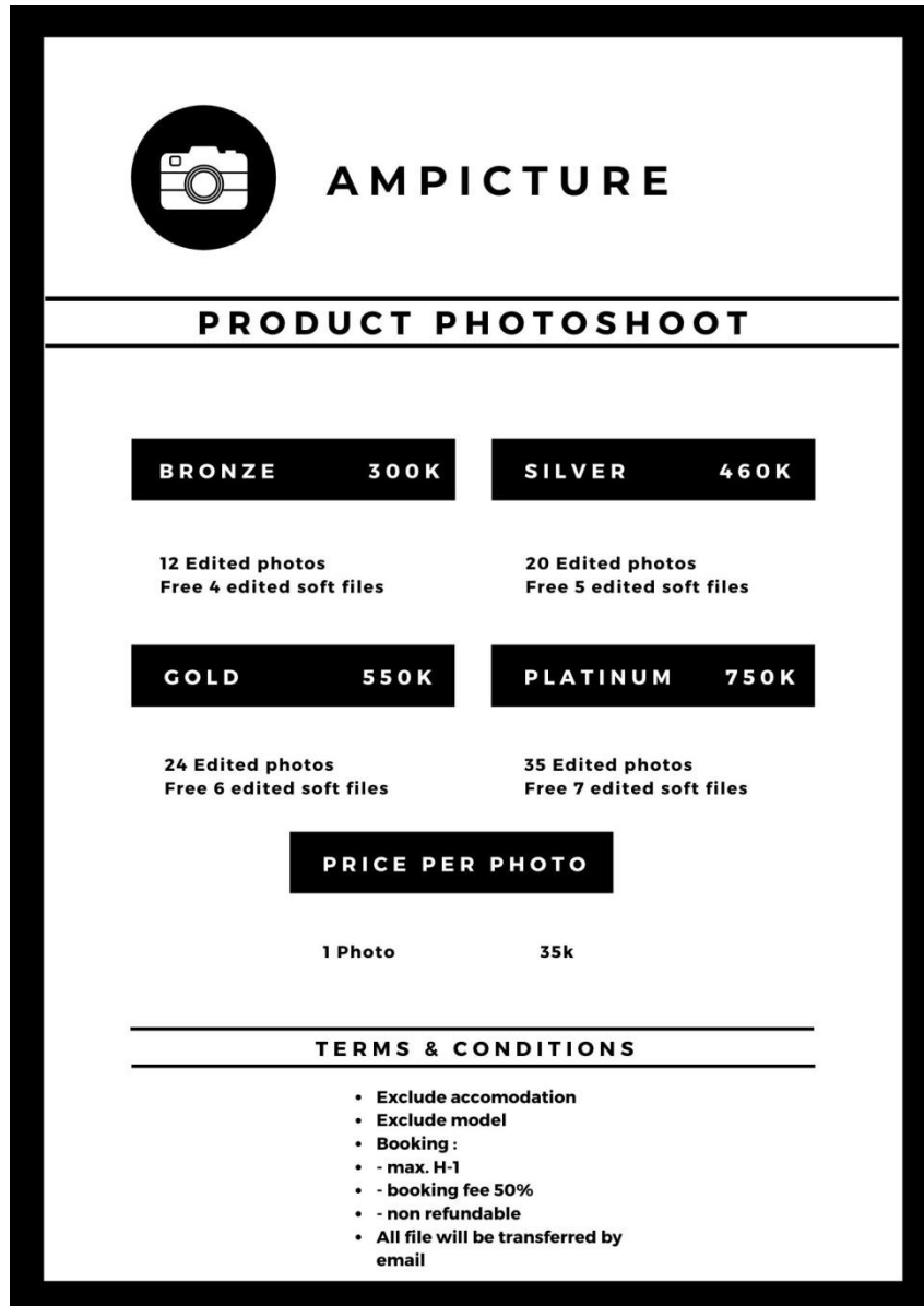
Gambar II. 11 Pricelist Product Photoshoot