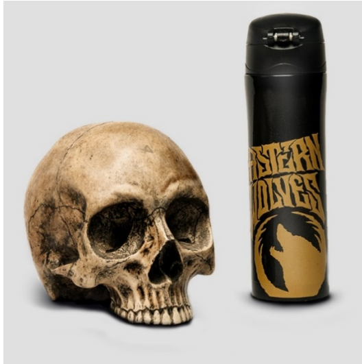
Gambar II.5 Botol minum