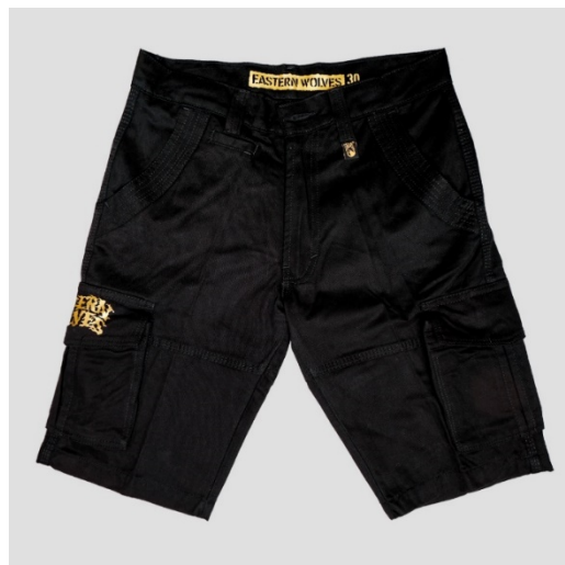
Gambar II.8 Celana cargo

Penjelasan : barang penjualan Eastern Wolves