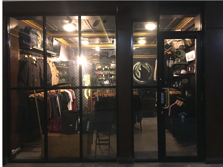
Gambar II.3 Tampak luar toko Eastern Wolves