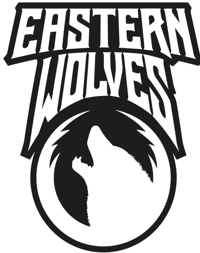
Gambar II.1 Logo Perusahaan

Logo adalah hal yang penting bagi suatu perusahaan, karena logo merupakan suatu citra untuk identitas bagi perusahaan yang menggunakannya. Logo mark adalah salah satu jenis logo yang sudah digunakan oleh manusia selama berabad-abad dan hal tersebut haruslah mencitrakan suatu identitas dari apa yang logo itu wakilkkan. Perusahaan CV. Eastern Wolves Indonesia menggunakan jenis logo mark yang menggunakan objek utama kepala serigala dan terdapat Tulisan Eastern Wolves pada bagian atas logo.