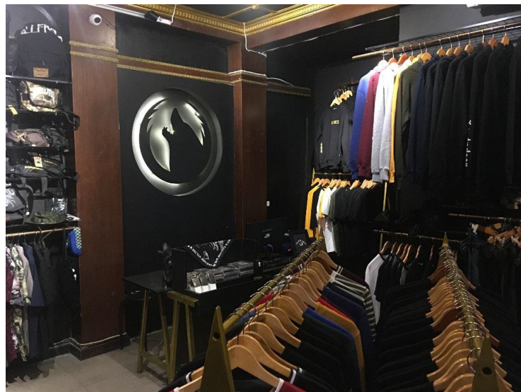
Gambar II.4 Tampak dalam toko Eastern Wolves