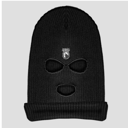
Gambar II.7 MARV MASK