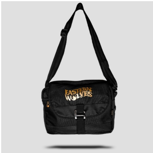
Gambar II.6 Tas selempang

Penjelasan : barang penjualan Eastern Wolves