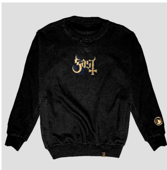
Gambar II.10 baju hangat

Penjelasan : barang penjualan Eastern Wolves