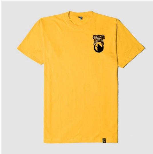
Gambar II.9 Kaos oblong