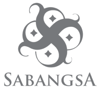
Gambar II.1 Logo Perusahaan Sabangsa Indonesia

Nama Perusahaan : Sabangsa Indonesia Alamat : Komplek Nata Endah Blok B no. B19 I Rt 02/05, Kelurahan Margahayu Tengah, Margahayu Kopo, Kabupaten Bandung 40225 Telp : 0821 2021 1233 Email : sabangsaindonesia@gmail.com Bidang Usaha : Fashion dan Kriya