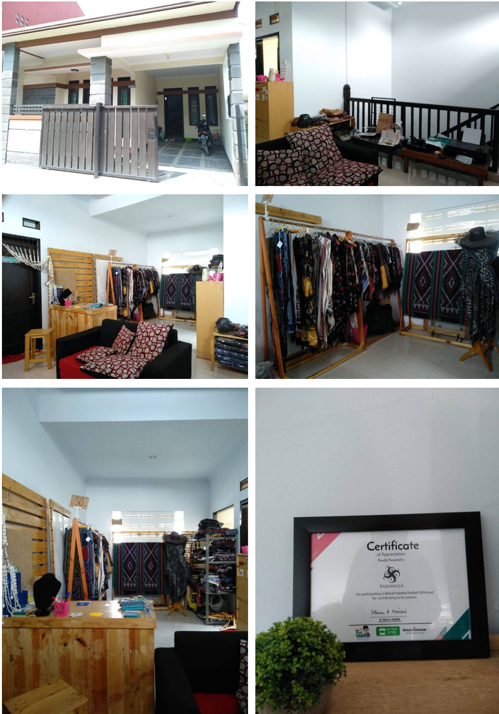
Gambar II.2 Lokasi dan Suasana Perusahaan Sabangsa Indonesia