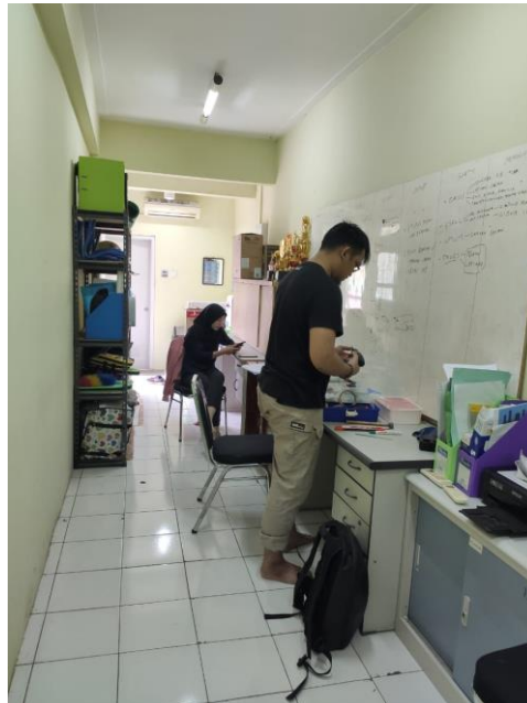
Gambar II.4 Bagian Dalam Kantor CV. Maestro Bisa