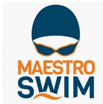
Gambar II.2 Logo Maestro Swim