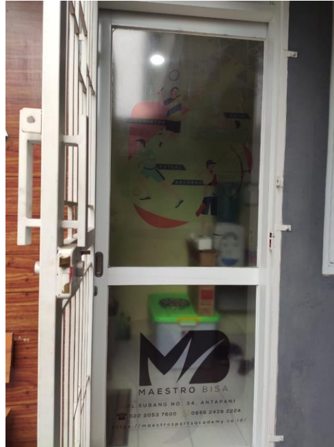
Gambar II.3 Pintu Depan Kantor CV. Maestro Bisa Sumber: Dokumen Pribadi (2020)

Berikut hasil dokumentasi dari kantor CV. Maestro Bisa: