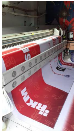
Gambar II.2 Mesin Cetak Outdoor .

Mesin cetak outdoor digunakan untuk mencetak spanduk yang dipasang di luar ruangan. Kapasitas mesin ini bisa digunakan untuk mencetak kurang lebih 5m 2 /jam.