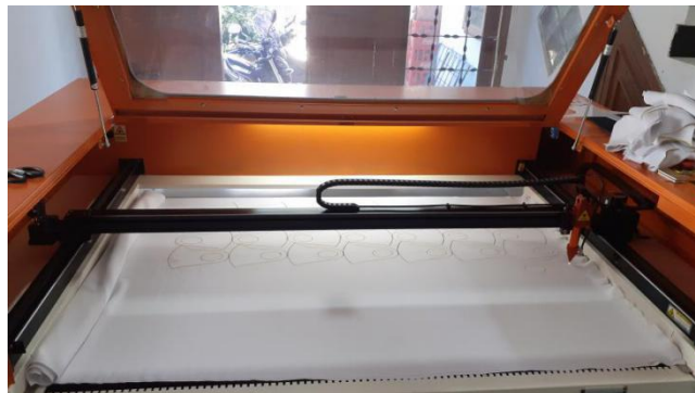
Gambar II.6 Mesin Potong Laser.

Mesin Potong Laser digunakan untuk memotong kain, kayu, akrilik dan bahan-bahan lainnya sesuai kebutuhan.