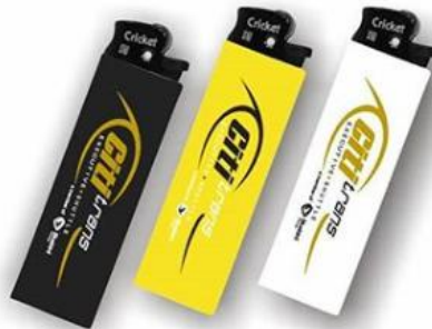
Gambar II.8 Korek Api Produksi CV. Way'n Graph

Berikut adalah beberapa hasil contoh produk yang pernah dibuat oleh CV. Way'n Graph. Produk-produk yang disebutkan menggunakan mesin-mesin diatas untuk proses pencetakannya.