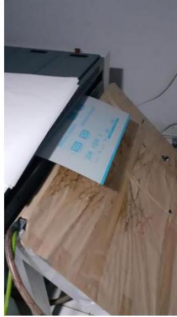
Gambar II.3 Mesin Cetak CTP.

Mesin Flatbed Cutting dan Cutting Plotter digunakan untuk memotong stiker dalam berbagai bentuk.