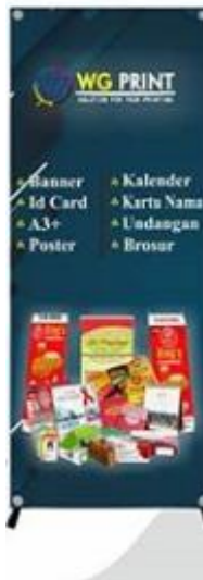
Gambar II.10 X-Banner Produksi CV. Way'n Graph