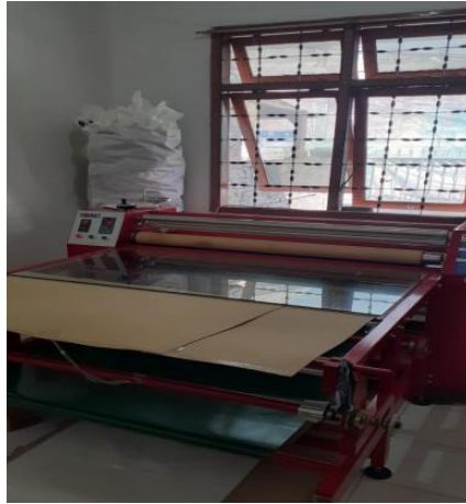
Gambar II.7 Mesin Press.