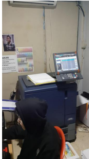
Gambar II.5 Mesin Print Laser A3+