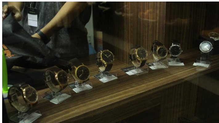
Gambar II.10 Produk Jam Guten Inc