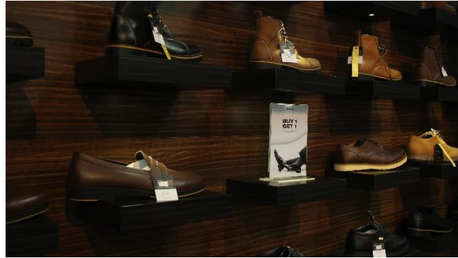
Gambar II.3 Produk Sepatu Kulit Guten Inc

Produk yang ditawarkan oleh PT. Guten Inc Group berupa sepatu kulit, baju, kemeja, jaket, tas, celana, sandal dan jam. Berikut adalah produk Guten Inc.