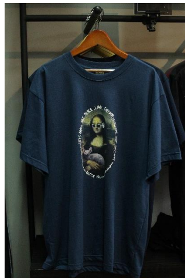
Gambar II.4 Produk Baju Guten Inc