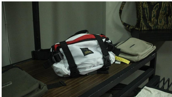
Gambar II.7 Produk Tas Guten Inc