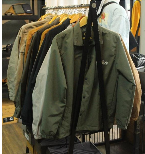
Gambar II.6 Produk Jaket Guten Inc