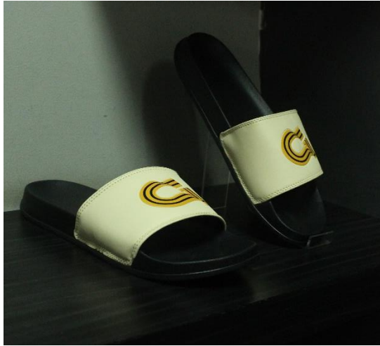
Gambar II.9 Produk Sandal Guten Inc