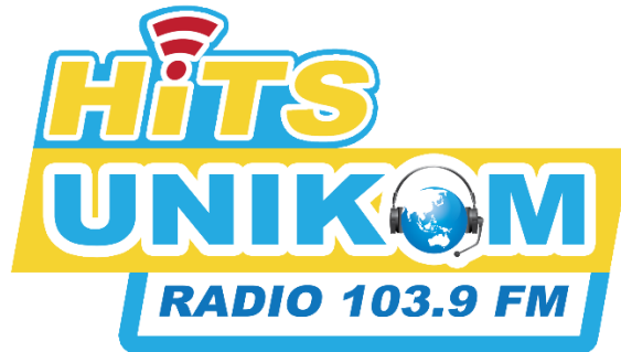
Gambar II.2. logo Hits Unikom Radio