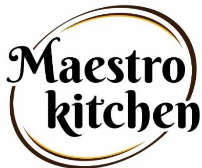
Gambar II.3 Logo Maestro Kitchen

https://res.cloudinary.com/parentstory/image/upload/v1547015164/dawkhntoefvu3tav5ay1.png (Diakses pada 21/07/2020)