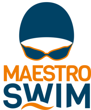
Gambar II.2 Logo Maestro Swim