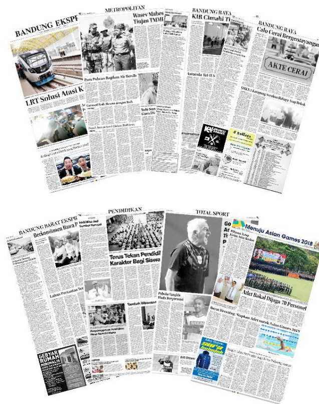
Gambar II.4 Surat Kabar Media Cetak

Selama berdirinya PT. Wahana Semesta Bandung Ekspres sudah menghasilkan banyak mitra bisnis yang bekerjasama. Dari semua mitra kerjasama sebagian besar berbentuk desain sosialisasi dan publikasi dari masing-masing mitra (klien). Dan produk yang dihasilkan seperti surat kabar berbentuk media cetak dan media online. Berikut beberapa surat kabar yang sudah di kerjakan oleh PT. Wahana Semesta Bandng Ekspres.