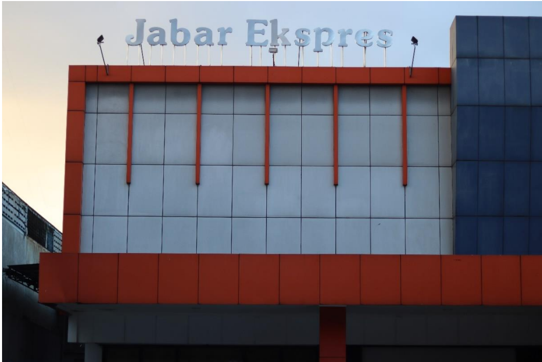
Gambar II.1 Kantor Jabar Ekspres