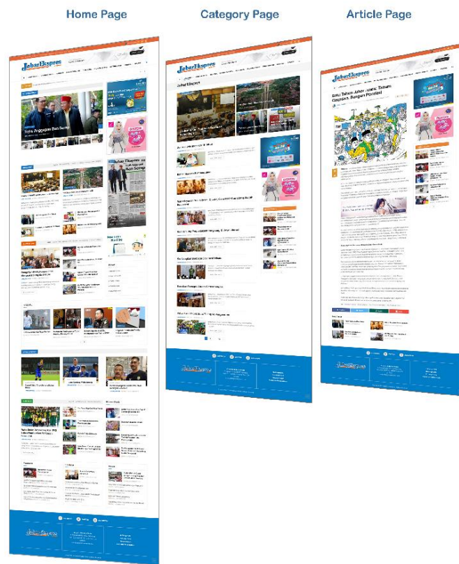
Gambar II.5 Surat Kabar Media Online