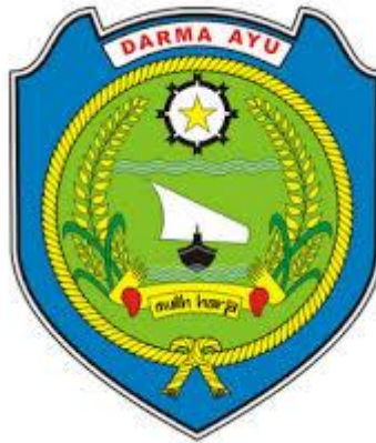
Gambar 2.2 Logo Kecamatan Gabuswetan,Indramayu

Berikut logo kecamatan Gabuswetan Indramayu