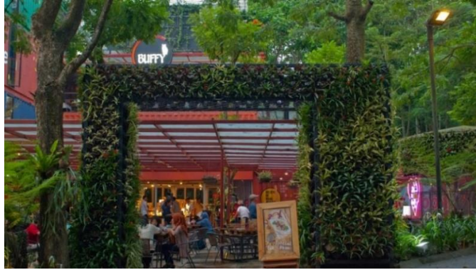
Gambar II. 8 Foto Bagian Luar Kantor PT. Pramestha Mountain City Sumber: Arsip Dokumen Pramestha Mountain City (2018)