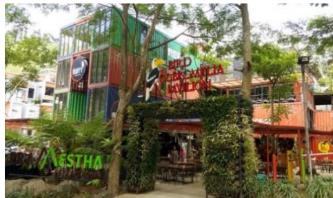
Gambar II. 7 Foto Suasana Luar PT. Pramestha Mountain City