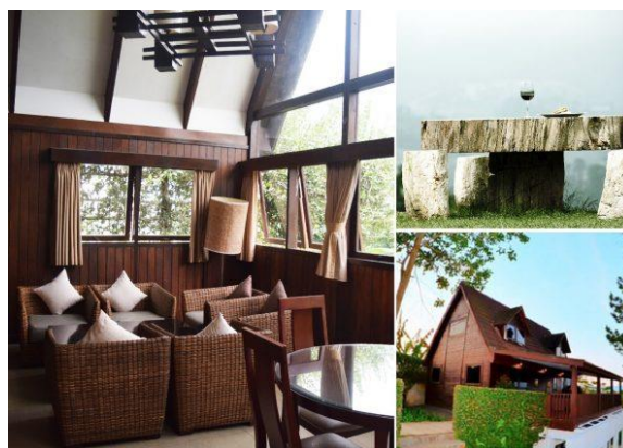
Gambar II. 5 Alea Villa

Wood Villa adalah suatu lambang dari kesuksesan. Pendekatan arsitektur Wood Villa sangat dekat dengan alam. Konsep yang dirancang Pramesta Mountain City menyediakan ruangan terbuka yang langsung melihat alam, lingkungan yang sejuk, serta bernuansa seperti taman rekreasi.