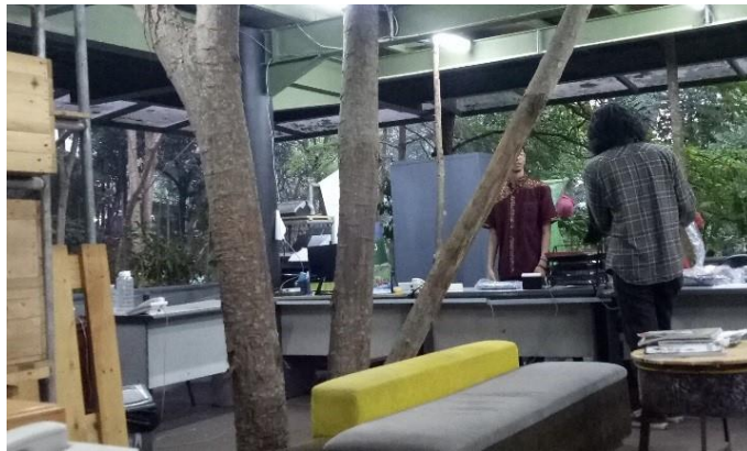
Gambar II. 9 Foto Bagian Dalam Kantor PT. Pramestha Mountain City