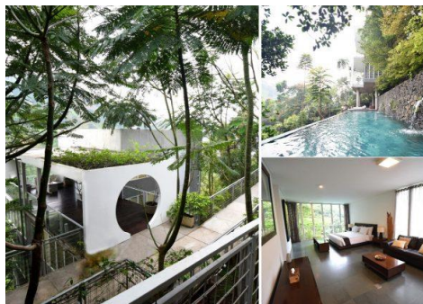
Gambar II. 3 Amala Villa

Amala dalam arti bahasa sansekerta yang berarti bersih, cerah dan tidak terhalang. Yang mendesain arsitektur Amala adalah Tan Tik Lam, Tan Tik Lam juga memberi tagline “ No Boundaries to Nature ”. Bangunan Amala terdiri dari empat lantai yang didirikan di lereng bukit buni wangi. Fasilitas Amala Villa terdiri dari lift pribadi, pantry, privateswimming pool dan barbeque deck .