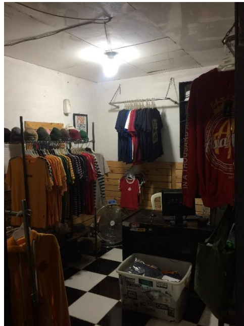
Gambar II.9 Foto tampak dalam toko CV. Tri Mitra Mandiri