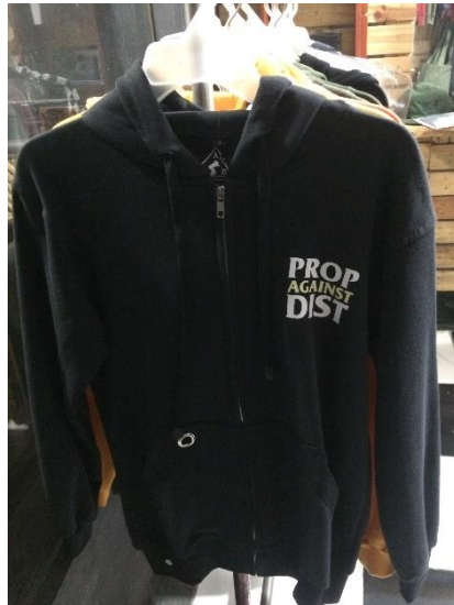
Gambar II.2 Produk jaket hoodie Propagainstdist

CV. Tri Mitra Mandiri memiliki produk Propagainstdist yang berbasis fashion karena perusahaan memproduksi hoodie , masker, T-shirt , berikut produk Propagainstdist.