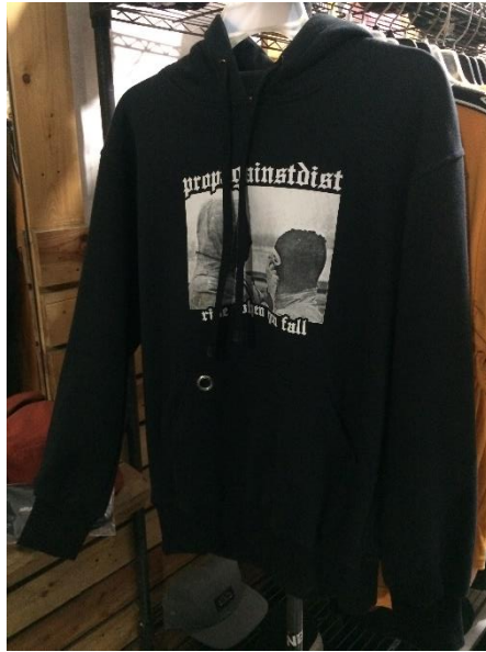
Gambar II.4 Produk jaket hoodie Propagainstdist