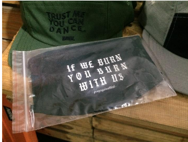
Gambar II.6 Produk masker Propagainstdist