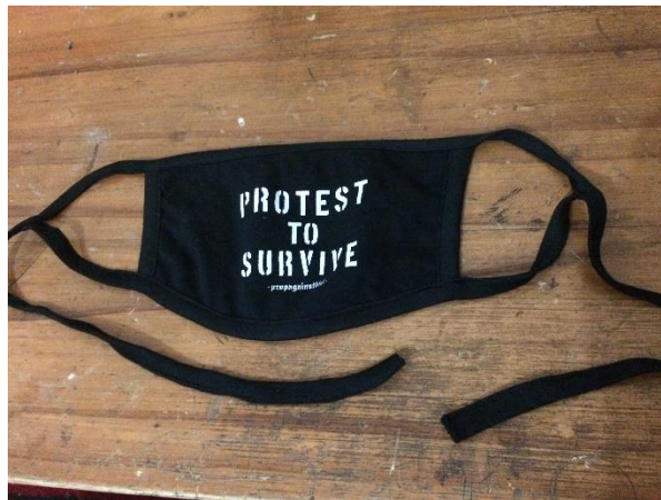
Gambar II.3 Produk masker Propagainstdist