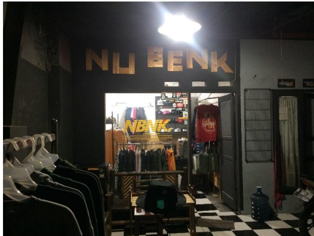
Gambar II.8 Foto tampak dari luar toko CV. Tri Mitra Mandiri