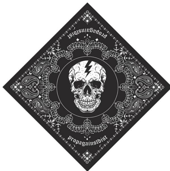
Gambar II.5 Produk bandana Propagainstdist