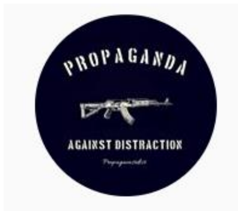
Gambar II.1 Logo perusahaan Propagaintsdist

Logo adalah salah satu cara agar orang mudah mengenali perusahaan tersebut untuk dapat dikenali dari melihat bentuk tersebut, Logo sendiri yaitu penyingkatan dari logotype yang sudah dikenali terlebih dahulu pada tahun 1810 – 1840. Seiring perkembangan logo terus berkembang dan mulai memainkan aspek ilustrasi dengan menampilkan huruf tertentu juga, ada juga Logotype yang dapat didesain dan diartikan dengan jenis huruf tertentu sehingga logo type dapat memuat tulus saja, (Rustan, 2009). Sama seperti logo Propagaintsdist yang menampilkan huruf dan ilustrasi agar mempertegas agar merek ini dapat dikenali.