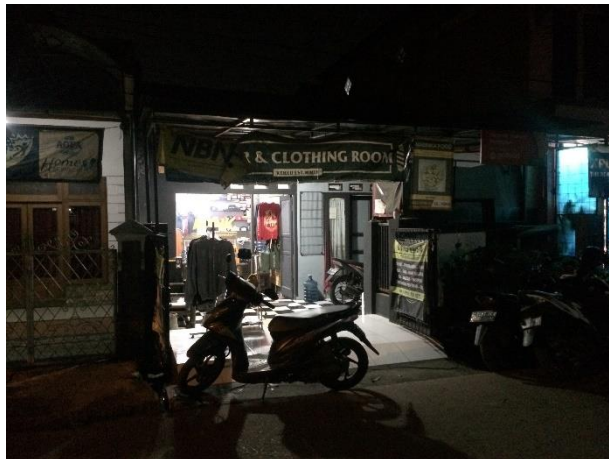
Gambar II.7 Foto tampak dari arah jalan raya toko CV. Tri Mitra

Foto tampak luar toko CV. Tri Mitra Mandiri mengarah kejalan raya