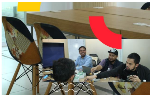
Gambar II.5 Meeting Room Eduplex