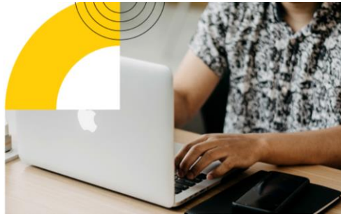
Gambar II.7 Virtual Office Eduplex