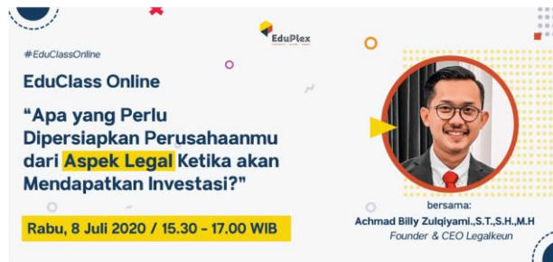
Gambar II.10 Event Educlass Online

Educlass online adalah webinar yang diselenggarakan oleh Eduplex dengan berbagai topik menarik terkait dengan bisnis dan kreatif.