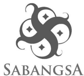
Gambar II.1 Logo Perusahaan Sabangsa Indonesia