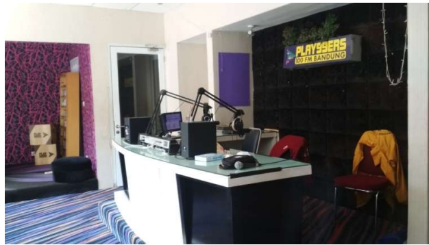
Gambar II.1 Foto Ruang Siaran

Nama Perusahaan : PT. Global Tekno Mediakom Alamat : Jln. Ir. H. Djuanda 126 B Bandung 40132 Telp / text : 022-251 5470 Email : contact@play99ers.com Website : www.play99ers.com Frekuensi : 100 FM