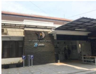
Gambar I.1 Kantor Perusahaan PT Dhaniz Dhita Utama

Perusahaan yang menjadi tempat kerja praktek yaitu PT. Dhaniz Dhita Utama. Perusahaan ini bergerak di bidang jasa kreatif, event, tour and travel dan retail Organizer, yang beralamatkan di Jl. Gamelan No.7, Turangga, Kec. Lengkong, Kota Bandung, Jawa Barat.