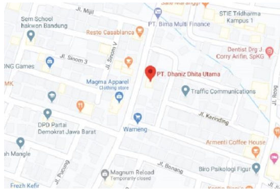
Gambar I.2 Alamat Perusahaan PT. Dhaniz Dhita Utama