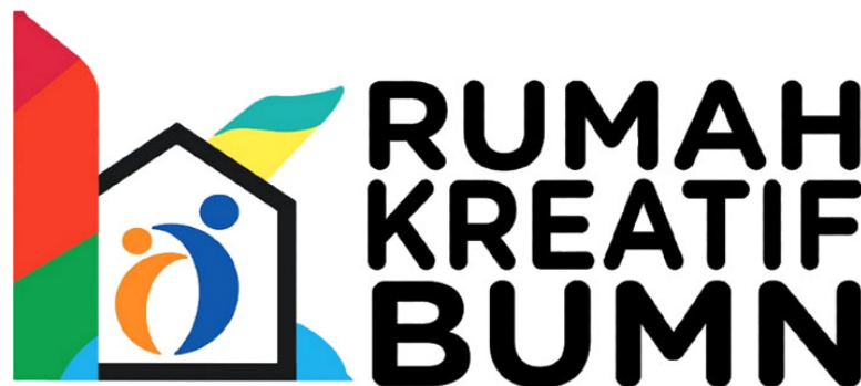
Gambar II.1 Logo RKB BUMN

Nama Perusahaan : Rumah Kreatif Bandung Alamat Perusahaan : Jurang No.50, Pasteur, Kec. Sukajadi, Kota Bandung, Jawa Barat 40161 Email : rumah kreatifbandung50@gmail.com Bidang usaha : Digital e-commers Bank Financial : Bank Rakyat Indonesia Badan hukum : Peratruran Menteri Negara Badan Usaha Milik Negera No. Per-05/MBU/2017 tentang program kemitraan badan usaha milik negara