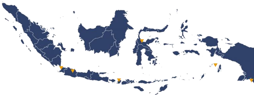
Gambar II.3 Peta persebaran donasi