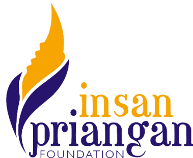
Gambar II.2 logo perusahaan Insan Priangan