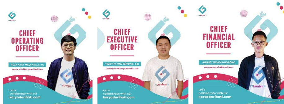
Gambar II.1 Foto 3 Pendiri Utama CV. Karya Dari Hati