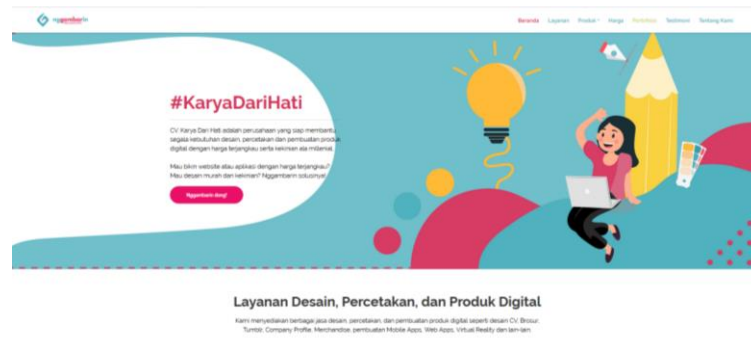
Gambar II.3 Website Nggambarin