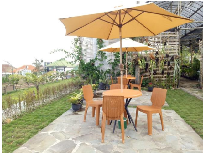
Gambar II.3.6 : Coffee Shop