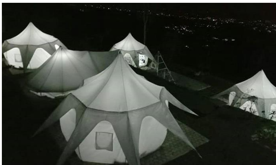
Gambar II.3.4 : Glamcamp