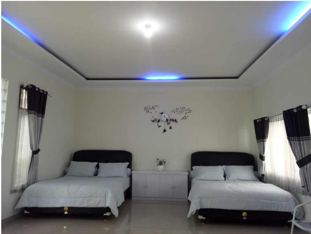
Gambar II.3.5 : Guest House