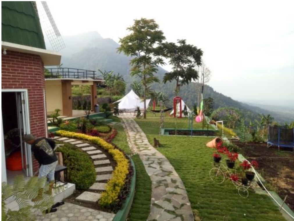
Gambar II.3.2 : Mini Wisata