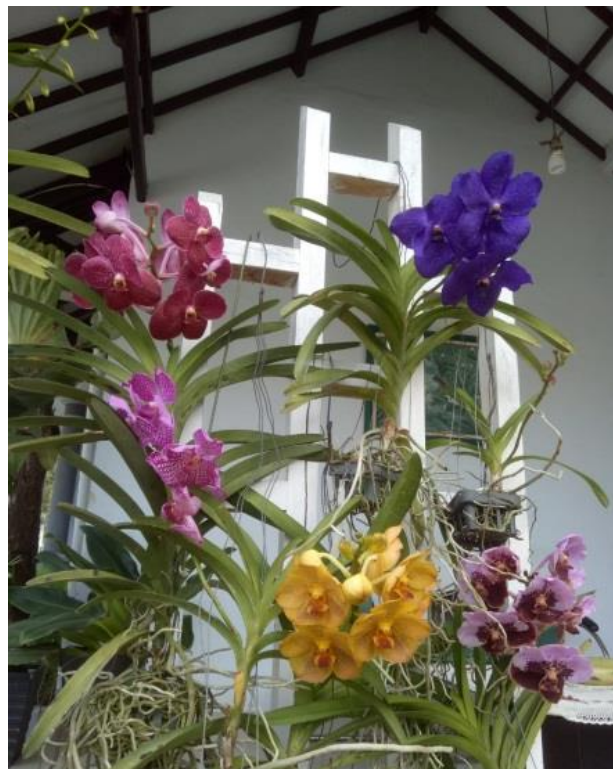
Gambar II.3.1 : Bunga Potong