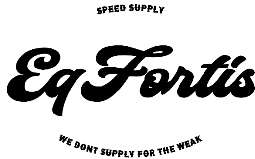
Gambar II.1 Logo Eq Fortis

Tangguh. Lalu di bagian atas dan bawah nama Eq fortis itu terdapat slogan yang bertuliskan “ Speed Supply ” dan “ We Don’t Supply For The Weak ” yang mengartikan bahwa Eq Fortis ini akan memberikan yang terbaik untuk para pembeli produk itu sendiri.