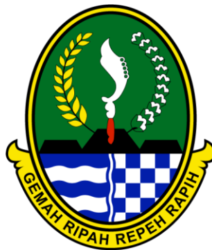
Gambar II. 2 1 Logo Provinsi Jawa Barat