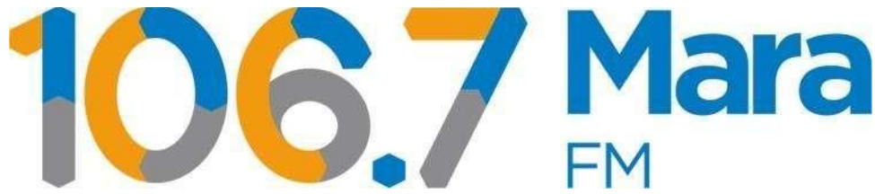
Gambar II.1 Logo Perusahaan

kuning yang berada di logo ini mengartikan kesan warna anak muda milenial sedangkan abu-abu pada logo ini berfungsi untuk menambahkan aksen saja.