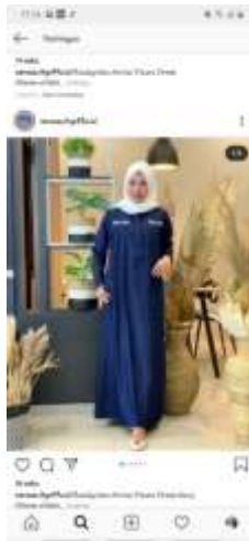
Gambar II.3 Contoh Produk CV. Indonesiana Kreasi.

CV. Indonesiana Kreasi bergerak di bidang jasa produksi/konveksi serta printing sublim selain dari bidang usaha utamanya yaitu clothing line pada sub-unit-nya, yaitu Versus City Store.