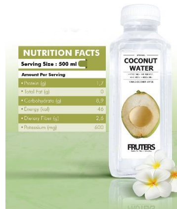
Gambar II.4.2 Coconut Water