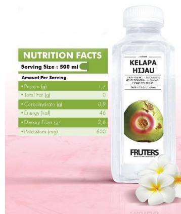
Gambar II.4.1 Kelapa Hijau 500ml