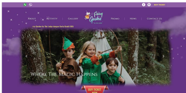
Gambar II. 4 Situs Fairy Garden