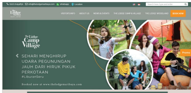
Gambar II. 3 Situs The Lodge Maribaya

Pinus Creative House pernah bekerja sama dengan beberapa perusahaan terkenal di Indonesia. Dan merek-merek tersebut berasal dari berbagai bidang-bidang yang berbeda. Mulai dari wisma, tempat rekreasi dan bahkan yang bergerak dibidang desainer fesyen. Beberapa perusahaan yang diberikan bantuan untuk pembuatan logo seperti The Lodge Maribaya, Mulberry Hill, Fairy Garden by The Lodge, Jakarta Aquarium hingga Bali Safari & Marine Park.