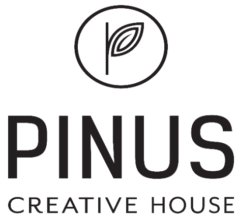
Gambar II. 1 Logo Perusahaan