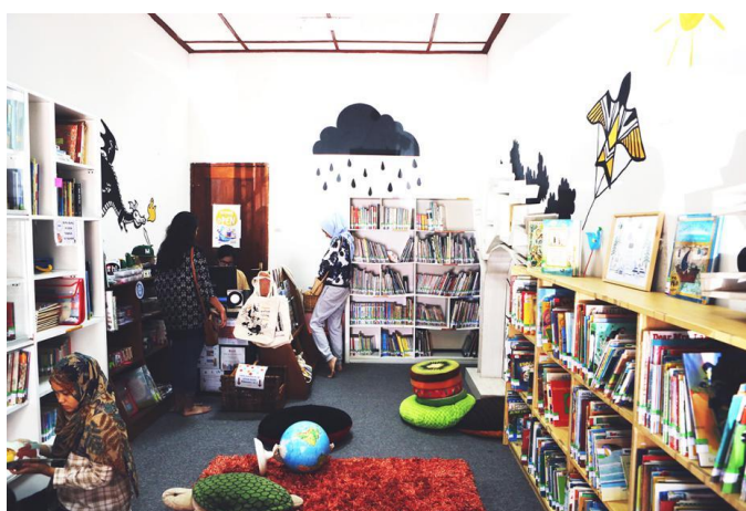
Gambar II.1 Pustakalana Children Library Selaras Guest House

Organisasi perpustakaan Pustakalana ini berada dibawah Yayasan Pustakalana. Pustakalana Children’s Library adalah Perpustakaan Anak dan Ruang Terbuka yang berjalan sejak 1 Desember 2015 di Kota Bandung yang dijalankan dengan semangat kerelawanan serta bersifat not for profit. Setelah sebelumnya selama 2.5 tahun bertempat di Simpul Space #, Bandung Creative City Forum (BCCF). Jalan Taman Cibeunying Selatan No.5, Bandung, saat ini Pustakalana berlokasi di Lantai 2, Selaras Guest House and Restaurant, Jl. Taman Cibeunying Selatan No. 45, Bandung. Keberadaan Pustakalana diharapkan dapat menjadi tempat di mana orangtua (atau pendamping anak lainnya) dapat meluangkan waktu bersama anak untuk membaca bersama, menjadi alternatif tempat baik bagi anak maupun untuk orangtua agar dapat bermain dan saling bertukar pikiran, serta mendapatkan akses mudah untuk bisa membaca buku-buku bermutu.