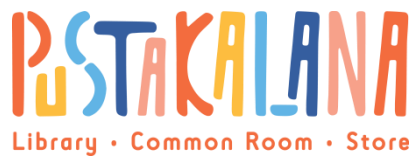
Gambar II.2 Logo Pustakalana Children Library

Logo adalah penyingkatan dari logotype . Istilah logotype ini dikenal lebih dulu dibandingkan kata logo pada tahun 1810 – 1840. Logotype diartikan sebagai tulisan nama entitas yang didesain secara khusus dengan menggunakan jenis huruf tertentu. Sehingga logotype pada mulanya hanya memuat tulisan saja (Rustan, 2009). Berikut adalah logo Pustakalana Children Library