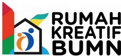
Gambar II.3 Logo Perusahaan RKB