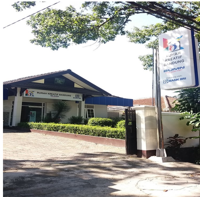
Gambar II.2 Kantor RKB

membantu akses pemasaran UKM di Indonesia melalui digital e-commerce . Selain itu guna meningkatkan kualitas UKM dan diharapkan berdampak kepada kemajuan dan peningkatan usaha UMKM yang dapat menciptakan sebuah Digital Economy Ecosystem yang baik.