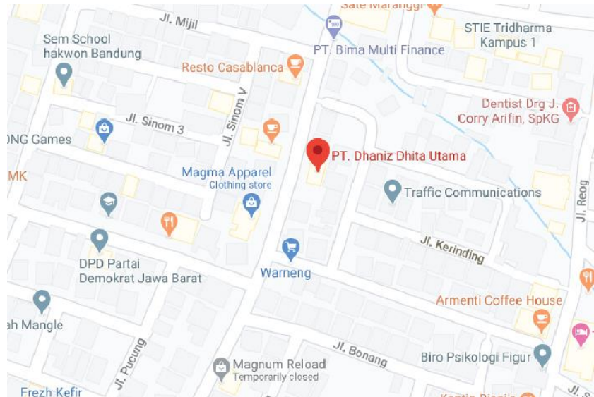
Gambar II.2 Alamat Perusahaan PT. Dhaniz Dhita Utama

Jl. Gamelan No. 7, Bandung 40264, West Java, Indonesia (022) 8732 6969