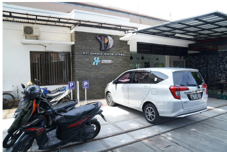
Gambar II.3 Tempat Perusahaan PT. Dhaniz Dhita Utama