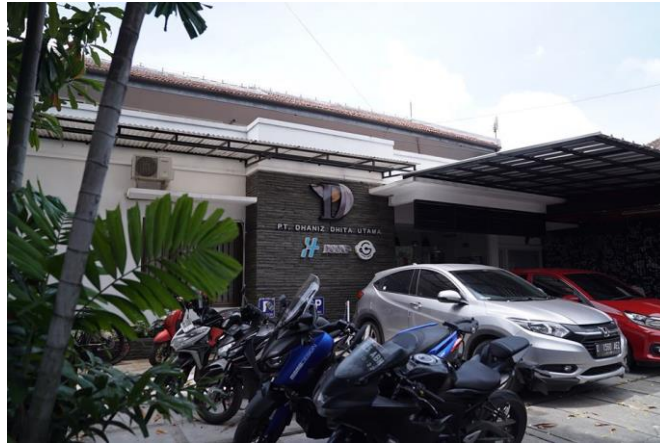
Gambar II.2 Tempat Perusahaan PT. Dhaniz Dhita Utama

PT. Dhaniz Dhita Utama yang beralamatkan di Jalan Gamelan No. 07, Turangga, Kec. Lengkong, Kota Bandung, Jawa Barat 40264.