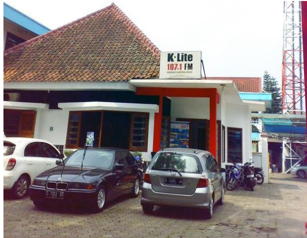
Gambar II.3 Bagian Depan Kantor Radio K-Lite