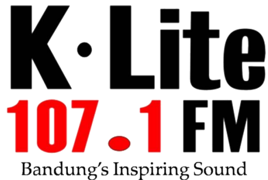
Gambar II.1 Logo K-lite