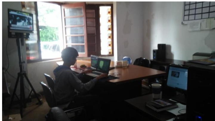
Gambar II.4 Ruang Anak Magang Bekerja