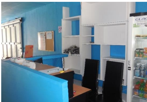
Gambar I.2 Tempat Resepsionis