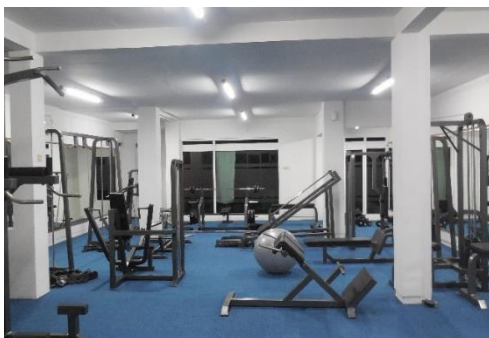
Gambar I.4 Ruang Gym