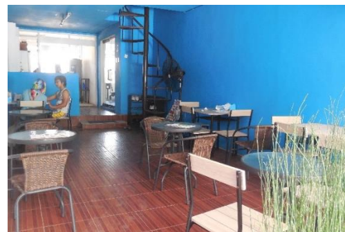
Gambar I.3 Cafeteria