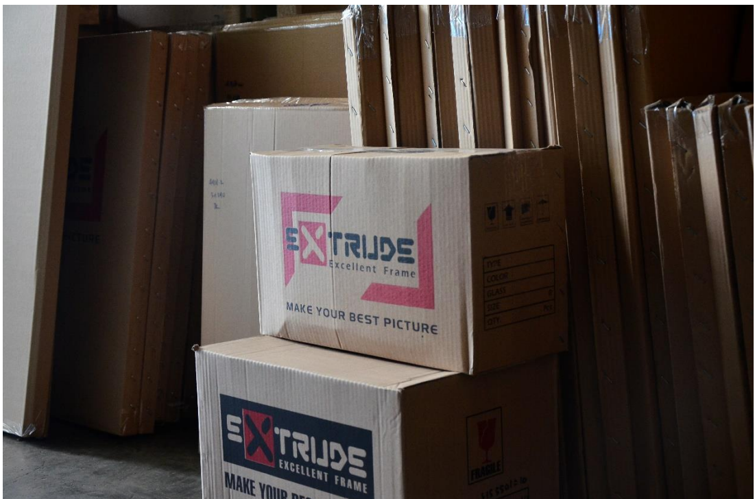
Gambar II.7 Frame Disatukan Dan Siap Dikirim