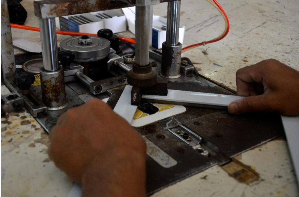
Gambar II.5 Menyatukan Frame