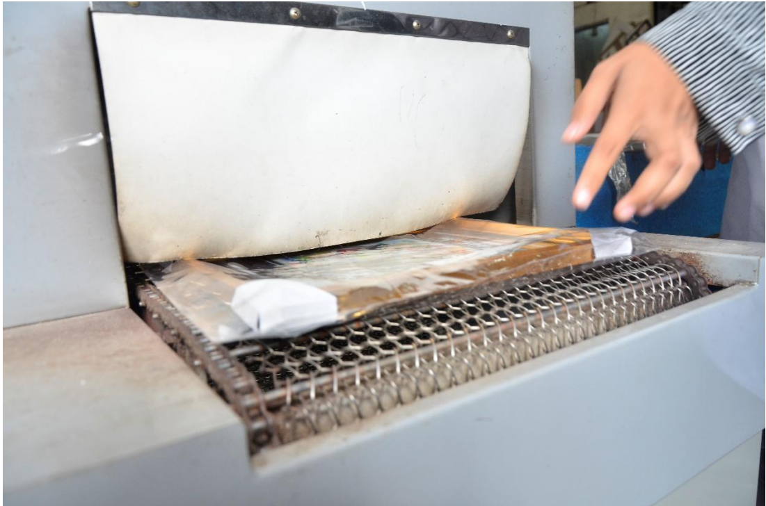
Gambar II.6 Membungkus Frame