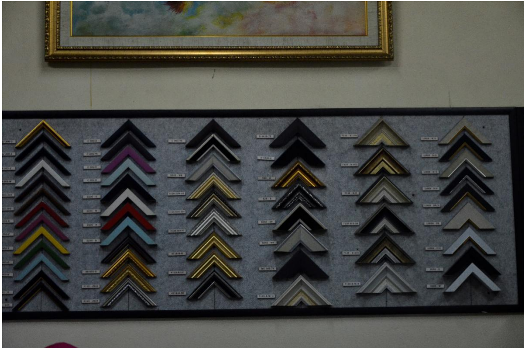
Gambar II.4 Contoh Contoh Frame