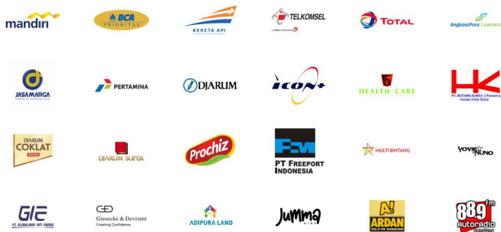
Gambar II.5 Daftar Klien PT. Pentacode Digital

Berikut adalah daftar beberapa klien PT. Pentacode Digital :