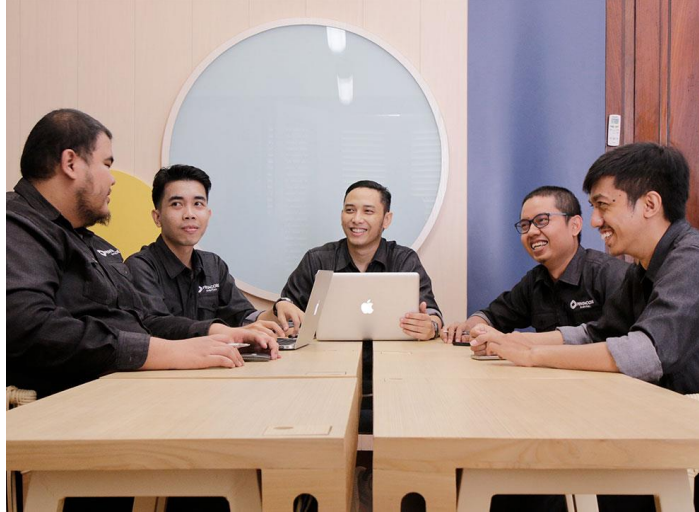
Gambar II.1 Sejarah PT. Pentacode Digital Sumber : https://pentacode.id (2020)

Pentacode mulai didirikan pada tahun 2008 dari sekelompok kecil teman yang mengembangkan perangkat lunak untuk bisnis-bisnis kecil. Ditahun 2009, Pentacode merilis perangkat lunak pertamanya yaitu Aplikasi Manajemen SMS dan Aplikasi Point of Sale mereka lahir. Dengan berkembang pesatnya bisnis, Pentacode menganggap bahwa ditahun 2012 adalah waktu yang tepat untuk menambah lebih banyak anggota untuk meningkatkan produktivitas perusahaan. 2012 hingga 2014 adalah tahun-tahun terbaik perusahaan. Pentacode menandatangani beberapa kontrak dari perusahaan multinasional di Indonesia. Diantaranya adalah Djarum Coklat, Telkomsel, Bank Mandiri, Freeport Indonesia, dan Pertamina. Pada tahun 2016, Pentacode melakukan penyegaran dan reBranding dengan mengubah nama perusahaannya menjadi PT Pentacode Digital. Dengan terwujudnya brand baru dan semangat baru, Perusahaan menjadi lebih solid dan lebih siap menghadapi tantangan apa pun di dunia teknologi yang berkembang pesat.