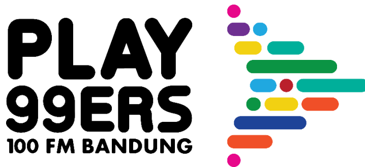
Gambar II.2 Logo PLAY99ERS