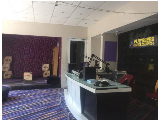
Gambar II.2 Ruang Siaran