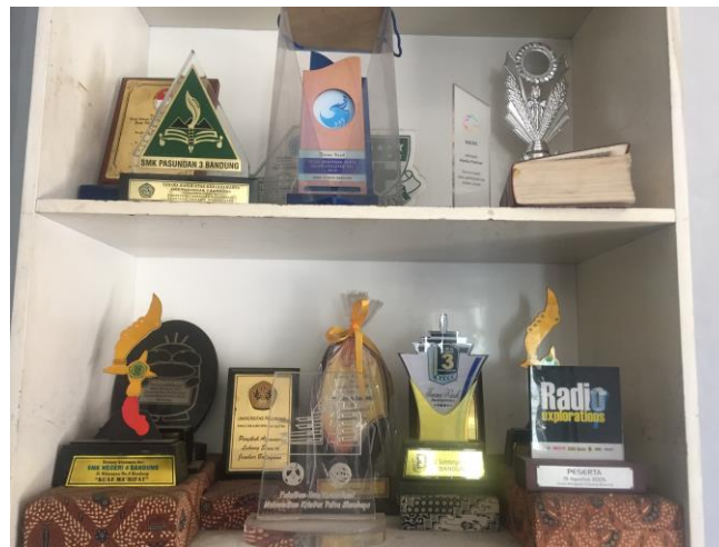
Gambar II.3 Penghargaan Radio