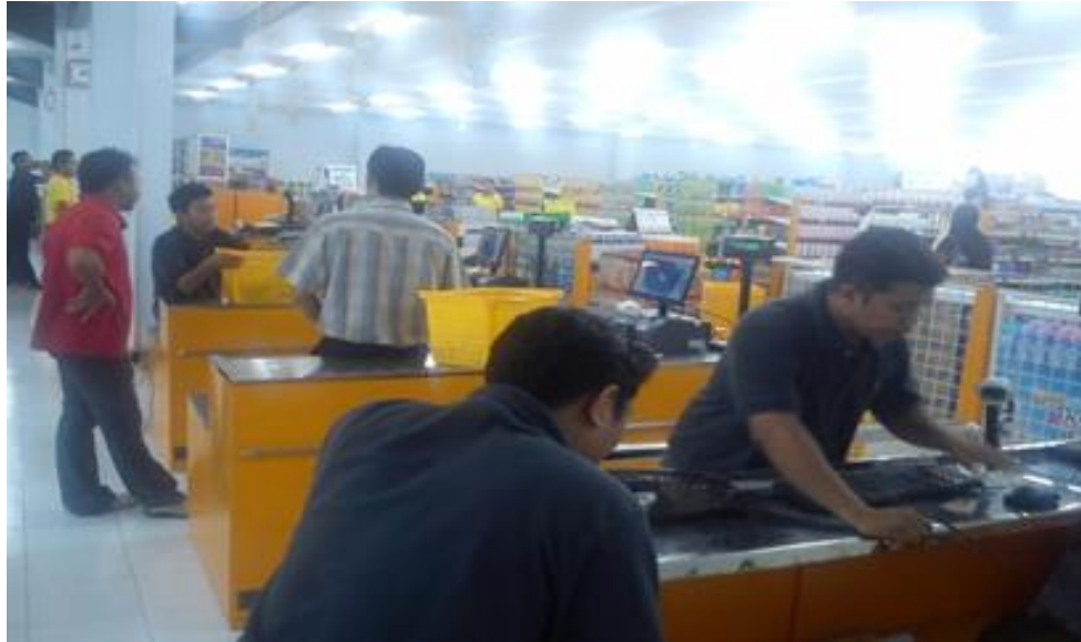
Gambar II.13 Mini Market