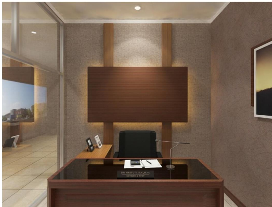
Gambar II.20 Interior Office