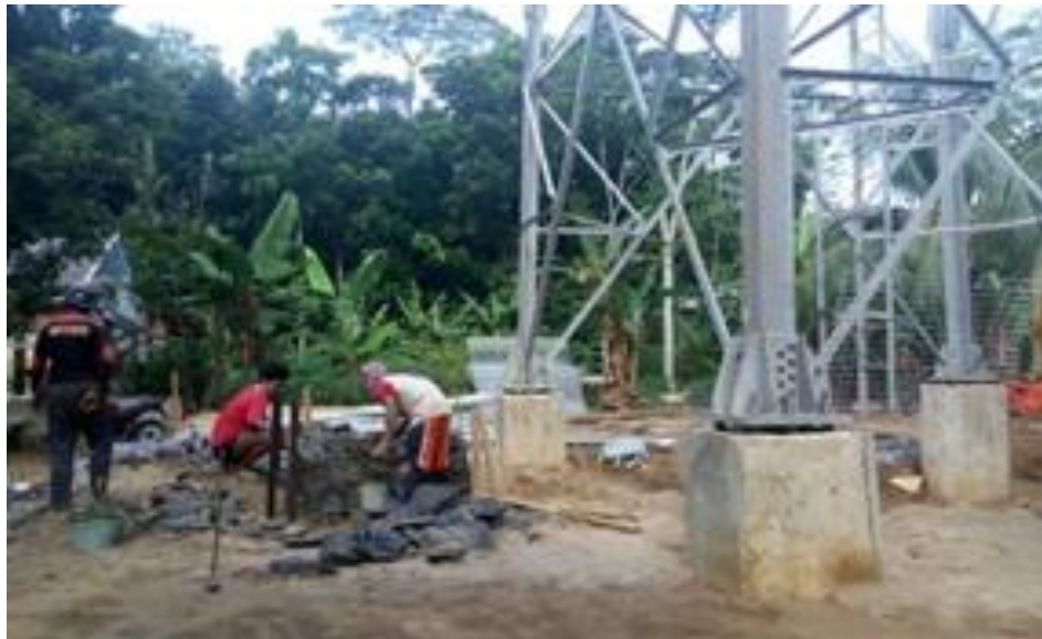
Gambar II.10 Instalasi Tower