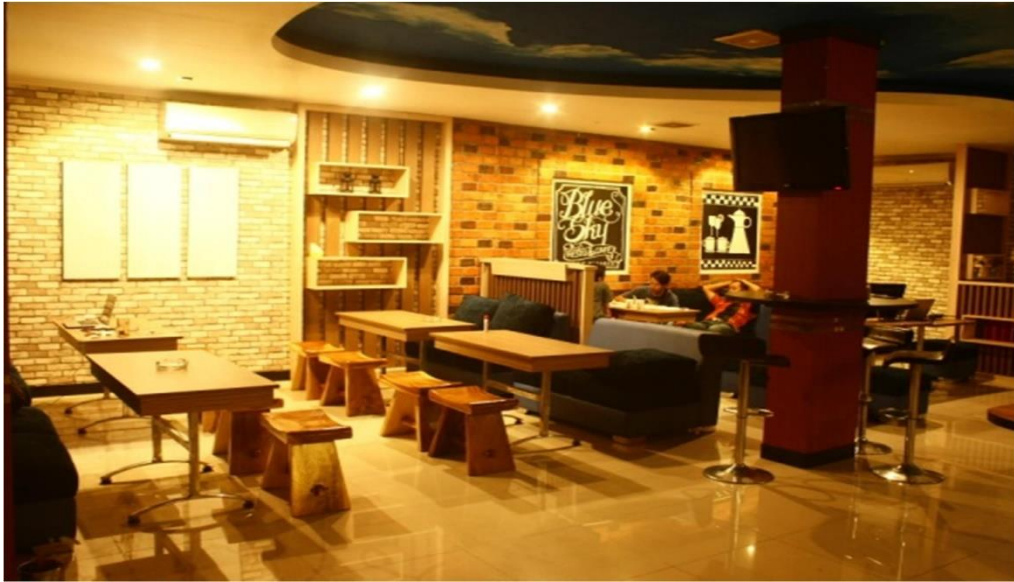
Gambar II.17 Café dan Resto