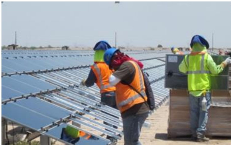
Gambar II.12 Instalasi Solar cell