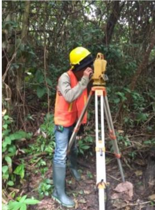
Gambar II.11 Topography