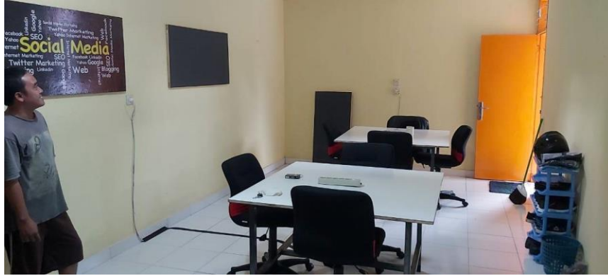
Gambar II.3 Ruang Kerja