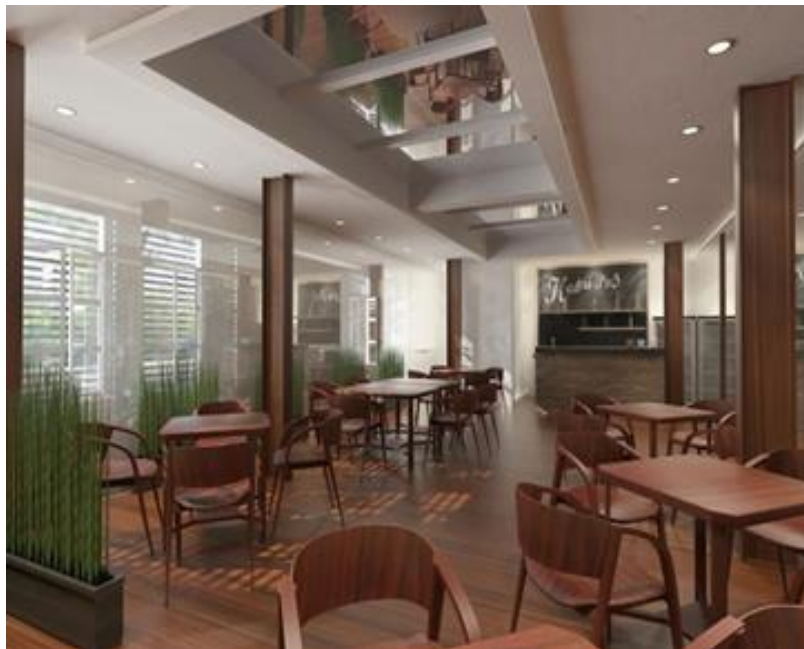
Gambar II.16 Resto