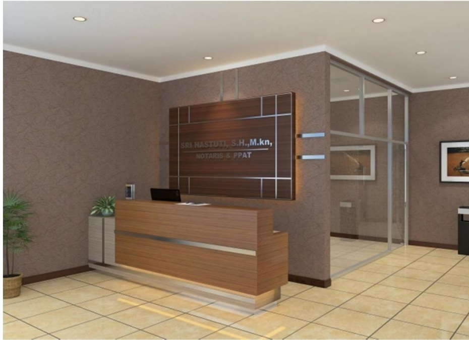
Gambar II.19 Interior Office