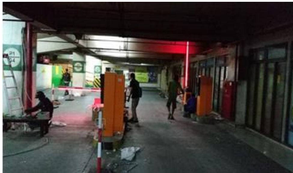
Gambar II.14 Parking