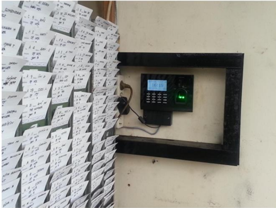
Gambar II.9 Instalasi Finger Print