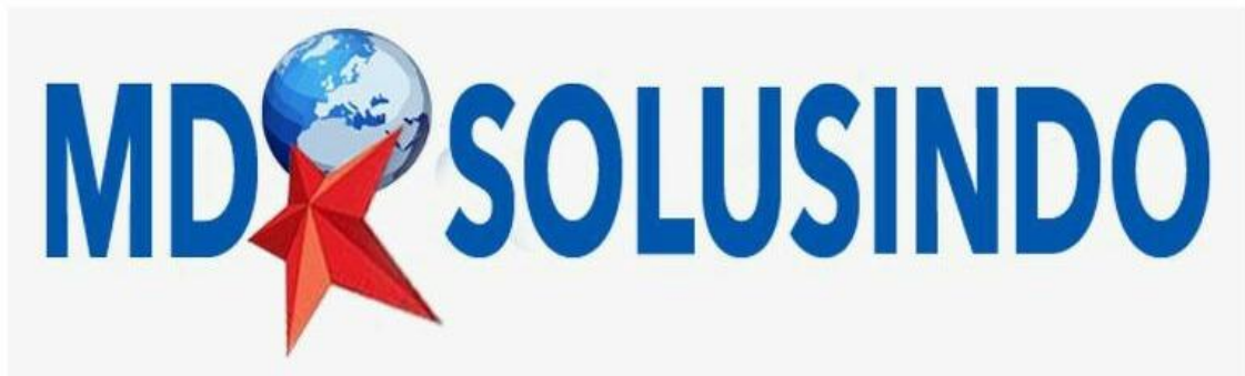
Gambar II.1 Logo PT.Mega Data Solusindo