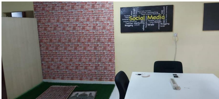
Gambar II.5 Mushola