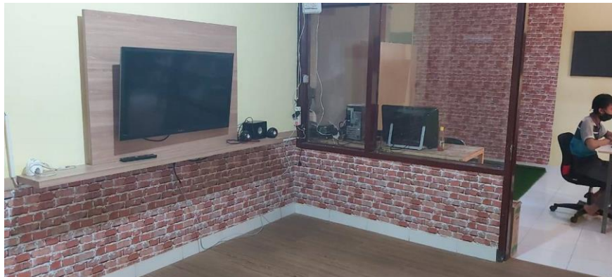
Gambar II.4 Ruang Kerja