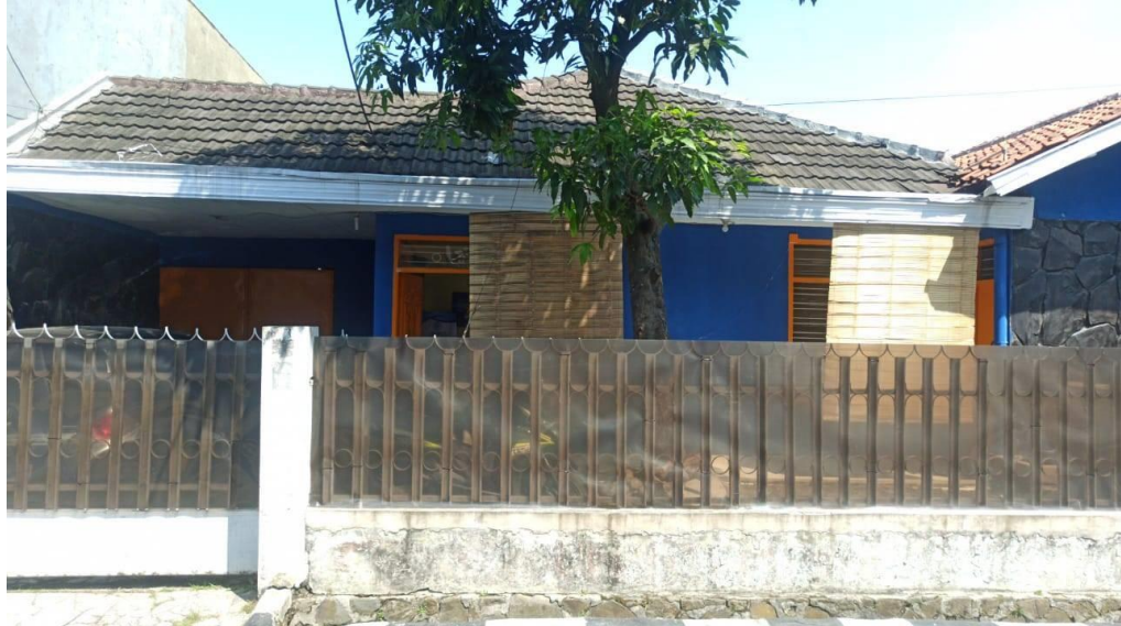
Gambar II.6 Luar Ruangan