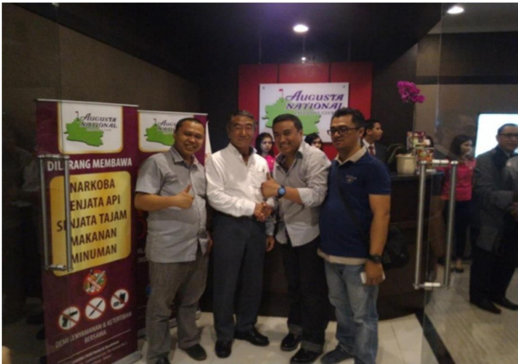
Gambar II.18 Café dan Resto