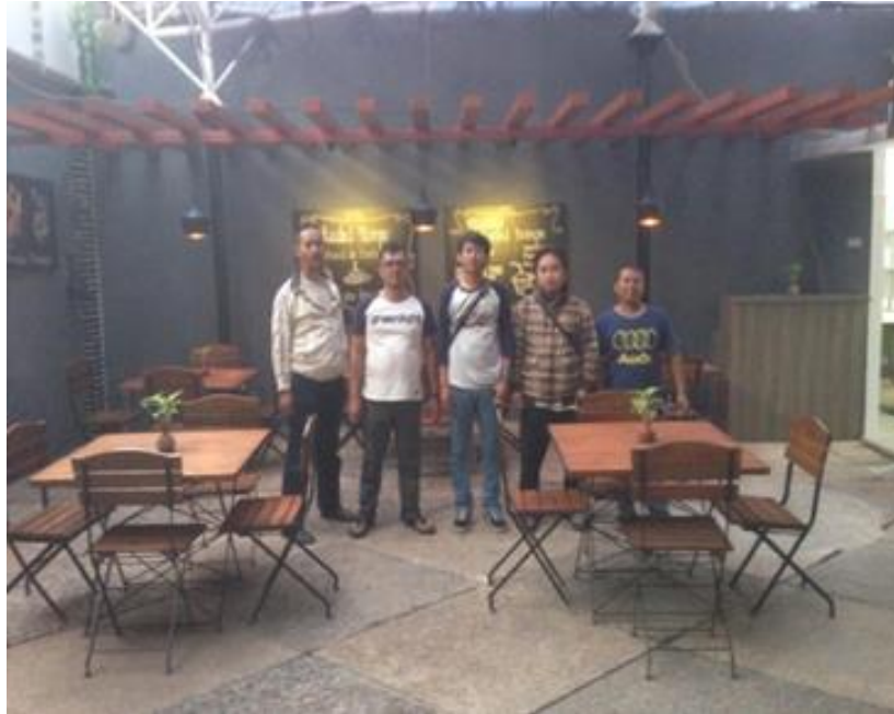
Gambar II.15 Café