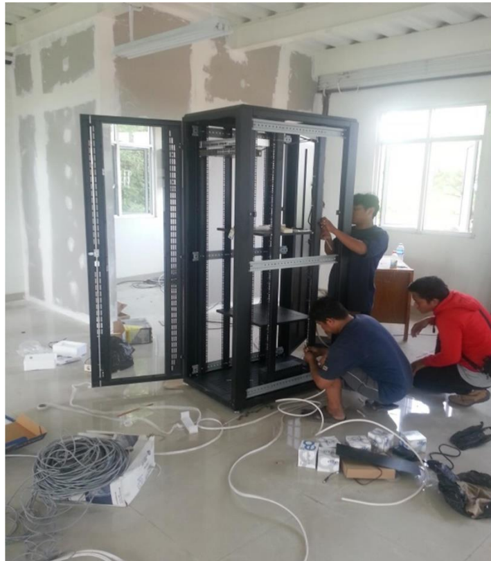
Gambar II.8 Instalasi lab server