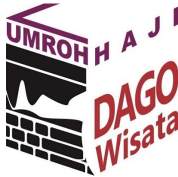
Gambar 2.1 Logo Umroh & Haji