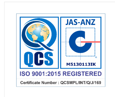
Gambar 2.3 Logo Iso