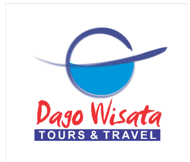
Gambar 2.2 Logo Tour