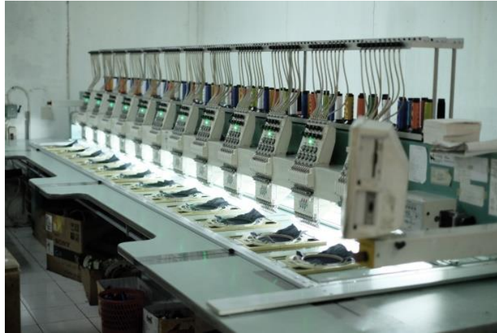
Gambar II. 2 Kantor CV. HUGOGRAPHY (DDF)