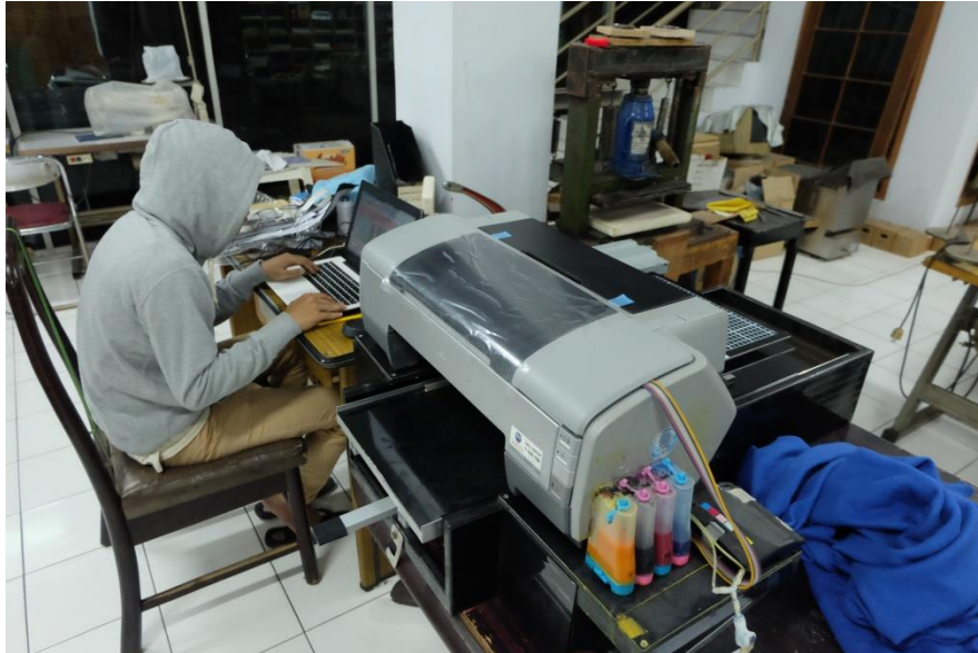
Gambar II. 4 Ruang Kerja CV. HUGOGRAPHY (DDF)

Suasana dan kegiatan praktikan beserta karyawan di kantor, selama praktikan melaksanakan kerja praktek sebagai syarat yang telah ditentukan oleh universitas.