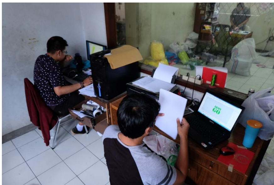
Gambar II. 5 Ruang Kerja CV. HUGOGRAPHY (DDF)