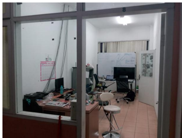
Gambar II.9 Ruang Kerja Praktikan