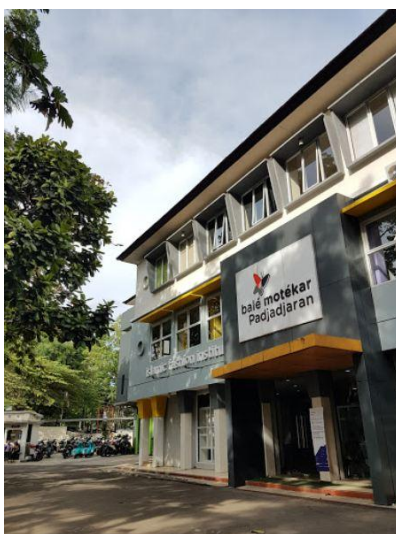
Gambar II.1 Gedung Bale Motekar (tampak luar)

Indicinema Bandung diresmikan pada tanggal 9 Desember 2016 dan diprakarsai oleh pengembang start up Digital Inovation Lounge (DILo) yang bekerja sama dengan komunitas Ruang Film Bandung. Marketing Indicinema Bandung, Iis Aminah mengatakan pendirian bioskop dilatarbelakangi kurangnya ruang penyaluran karya komunitas pembuat film di Bandung. Indicinema Bandung bertempat di Jalan Banda No. 40, tepatnya di gedung Bale Motekar Universitas Padjajaran lantai 3