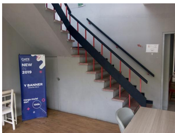
Gambar II.7 Tangga Menuju Lantai 2 & 3 Sumber: Pribadi (07/07/2019)