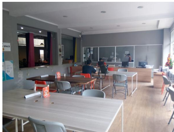
Gambar II.6 CMYK Co-working Space (tampak dalam) Sumber: Pribadi (07/07/2019)

Memasuki lantai 1 dari Bale Motekar yang memiliki 3 lantai, akan disambut dengan warna-warni CMYK yang ceria dengan dekorasi simple dan dominasi warna abu-abu. CMYK, yang merupakan kepanjangan dari Cyan , Magenta , Yellow dan Black adalah salah satu perusahaan yang bekerja sama dengan UNPAD. CMYK yang adalah perusahaan percetakan membuat kantor bergaya hybrid yang bisa digunakan oleh siapa saja sebagai co-working space dengan cuma-cuma. Co-working space gratis ini menyediakan meja-meja dan kursi nyaman yang masing-masing memiliki colokan.