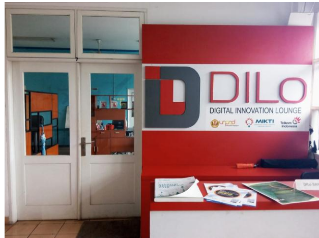
Gambar II.8 Kantor DILO

Lantai kedua dan ketiga adalah tempat untuk DILO yang merupakan singkatan dari Digital Innovation Lounge merupakan perusahaan kreatif yang bekerja sama dengan TELKOM dalam upaya mempertemukan peminat dan pelaku industri kreatif. DILO juga bisa digunakan sebagai co-working space dengan syarat mendaftarkan diri sebagai member .