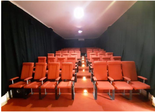
Gambar II.2 Ruang Bioskop (tampak dalam)