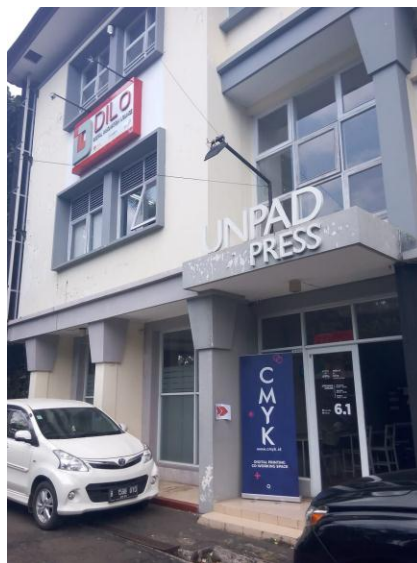
Gambar II.5 Pintu Masuk CMYK

Letak Indicinema Bandung bertempat di Jalan Banda No. 40, tepatnya di gedung Bale Motekar Universitas Padjajaran lantai 3. Gedung Bale Motekar merupakan milik dari Universtas Padjajaran yang diresmikan pada akhir September 2014 sebagai pusat inkubasi segala jenis kreativitas yang terbuka bukan hanya untuk civitas UNPAD tapi bagi masyarakat Bandung.