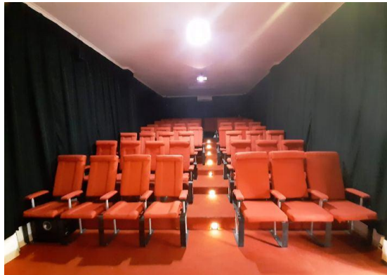
Gambar II.10 Ruang Bioskop (tampak dalam) Sumber: Pribadi (27/06/2019)

Berikut foto ruang bioskop yang disediakan Indicinema Bandung: