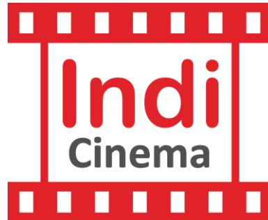
Gambar II.3 Logo Indicinema Bandung

membangkitkan emosi dan menciptakan perasaan kegembiraan dan semangat.