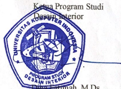
Ketua Program Studi Desain Interior