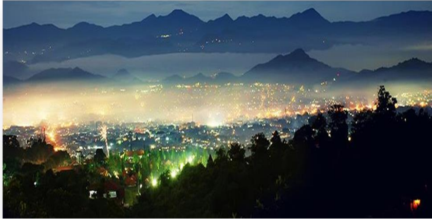
Gambar II.6 : Wisata Cimahi Torobosan

Citos (Cimahi Torobosan) adalah salah satu tempat/kampung rekreasi di Kota Cimahi yang terletak di Kel. Cipageran Kec. Cimahi Utara yang bisa menjadi alternatif bagi wisatawan yang ingin menikmati suasana pegunungan yang sejuk asri, berkemah dan membuat api unggun sambil menikmati minuman tradisional (bandrek bajigur, dll)