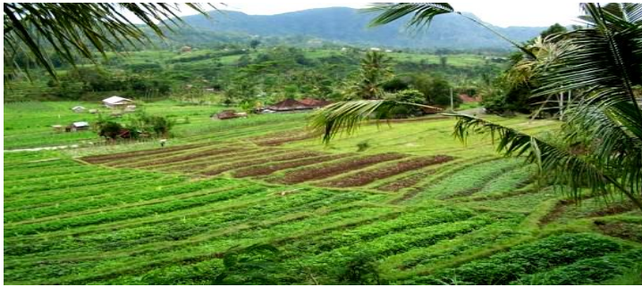
Gambar II.2 : Kampung Cireundeu

Kampung cireundeu terletak di kelurahan leuwi gajah, Cimahi Selatan. Wisata satu ini bisa menjadi alternatif bagi para pengunjung yang akan datang ke Kota Cimahi