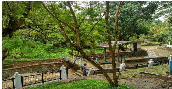
Gambar II.4 : Desa Wisata Cihanjuang

Kampung Wisata Cihanjuang adalah salah satu objek dan daya tarik wisata yang ada di Kota Cimahi yang terletak di Kel. Cibabat Kec. Cimahi Utara yang bisa menjadi alternatif bagi wisatawan yang ingin menikmati suasana yang berbeda dengan wisata alam lainnya.