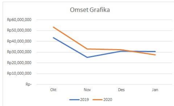
Gambar 1. 1 Diagram Pendapatan Grafika Studio

Google SpreadSheet dinilai kurang efektif untuk bersaing di era digital. Berikut Diagram Garis pendapatan selama menggunakan proses bisnis yang manual.