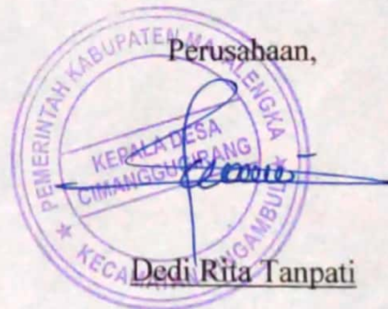
Dedi Rita Tanpati