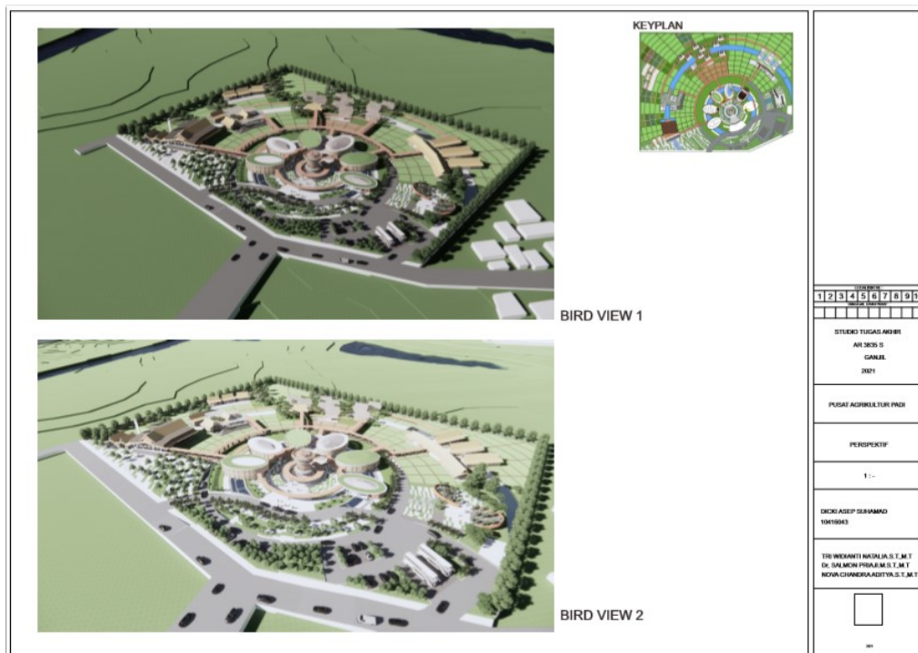
Figure 40 Perspektif mata burung 2