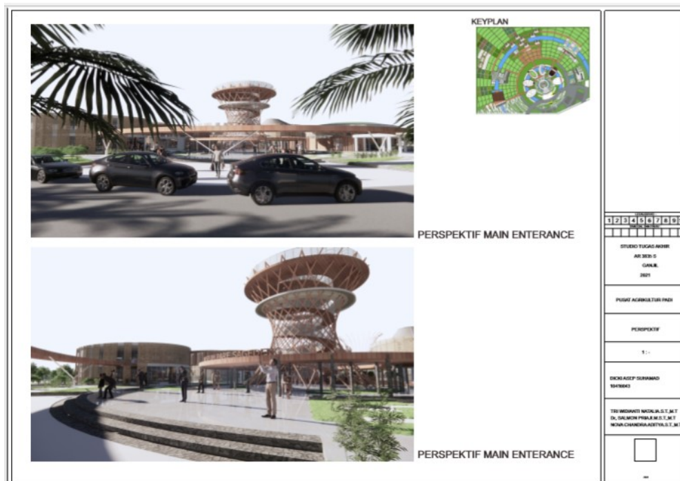
Figure 34 Suasana Main Entrance