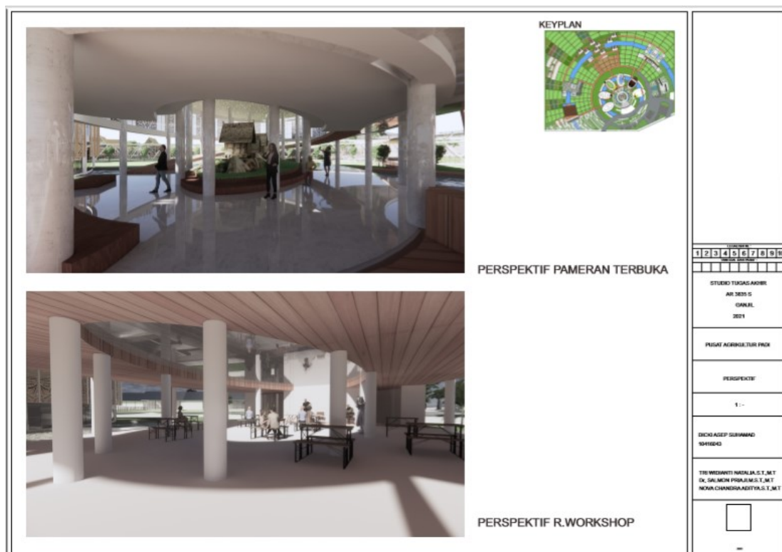
Figure 37 Susana ruang pameran terbuka & workshop