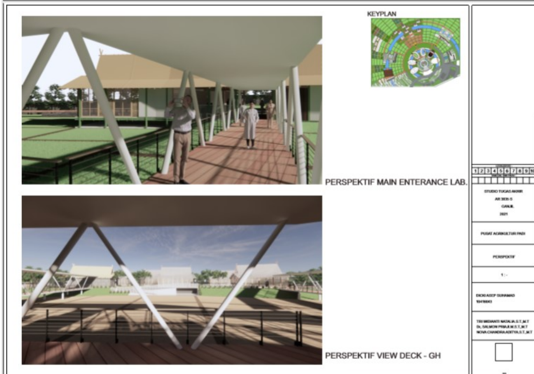
Figure 36 Susana main entrance balai penelitian dan view deck