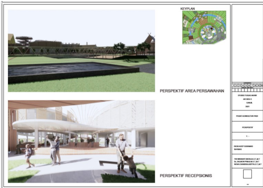
Figure 35 Susana Area Persawahan & Area Receptionis