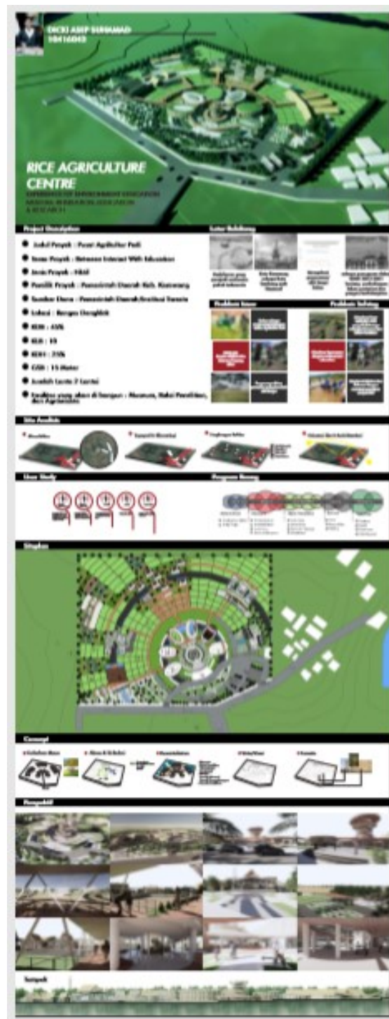
Figure 42 Persentasi board