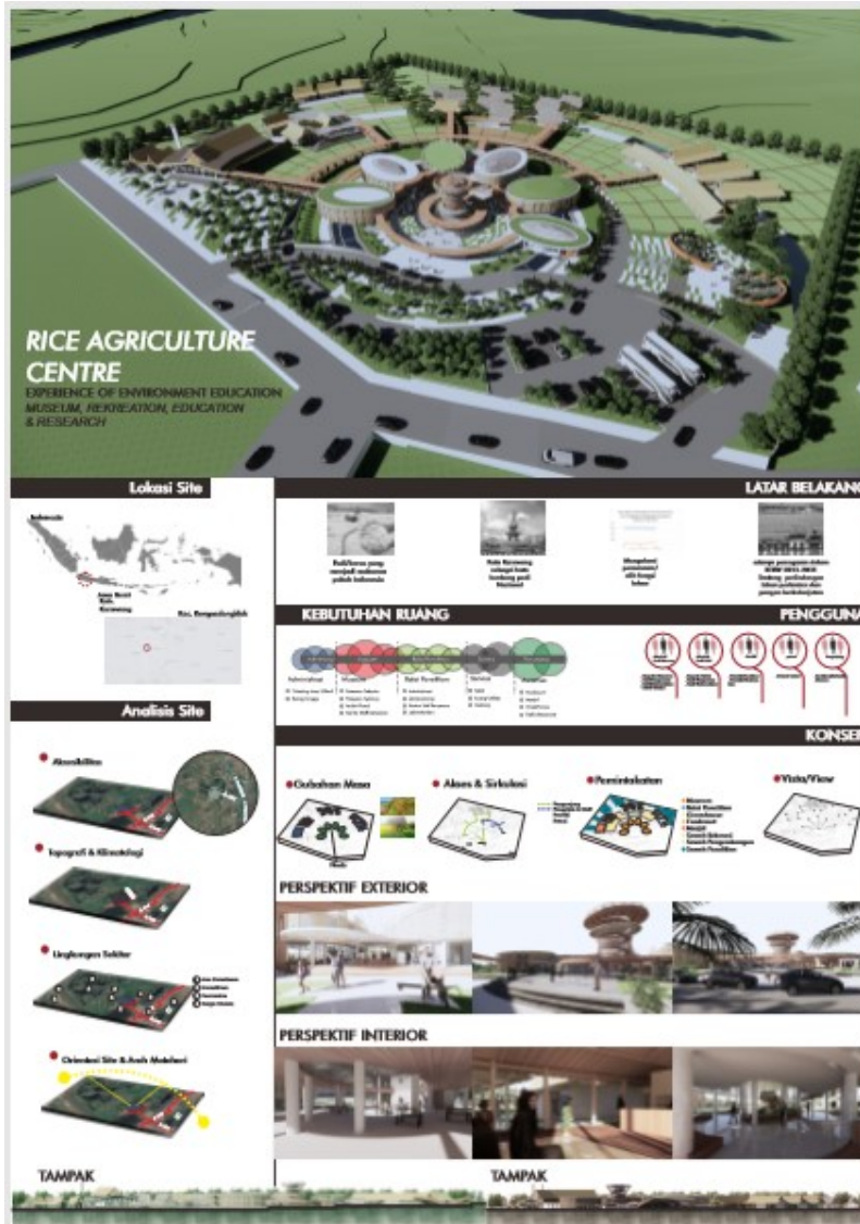
Figure 41 Panil Persentasi