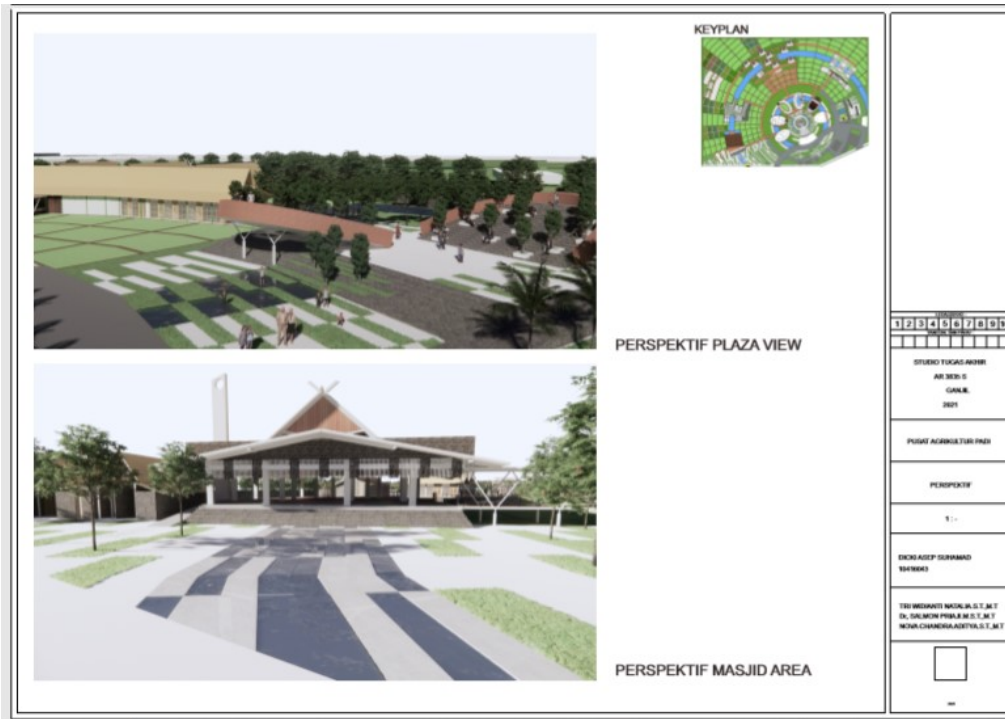
Figure 33 Suasana Eksterior Masjid & Plaza View