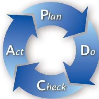
Gambar 2.3 Siklus PDCA ( Plan, Do, Check, Action )