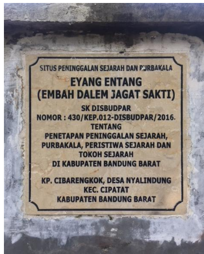
Gambar 3.1 Makam leluhur

Proses Acara Hajat arwah ini dimulai dari masyarakat yang kumpul di rumah tokoh masyarakat dan melakukan pawai budaya dengan iringan marawis dan lantunan Shalawat Nabi. Mereka berjalan sambil membawa kendi yang diisi daun hanjuang oleh anak anak menuju makam embah dalam jagasakti dari kampong Parakansalam menuju kampung Cibarengkok. Setelah sampai dimakam leluhur mereka duduk didepan makam seraya memanjatkan puji dan syukur kepada Allah SWT. Untuk memulai acara Abah Otib dan Abah Iing yang merupakan sesepuh turunan yang masih hiduplah yang membuka acara hajat arwah tersebut.