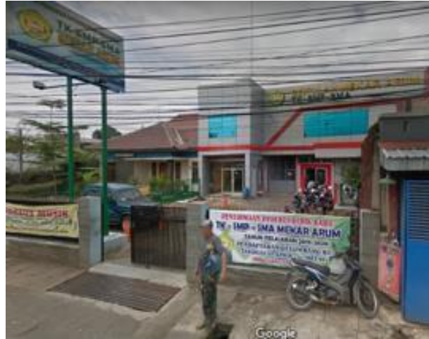
Gambar 2.13 SMA Mekar Arum Bandung

Sekolah SMA Mekar Arum merupakan yayasan pendidikan kebudayaan yang berdiri pada tanggal 27 Juni 1985 dengan tujuan membangun manusia yang berbudi pekerti, mulia, sehat jasmani dan rohani, cerdas dan terampil.