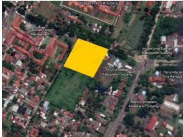
Gambar 2.1 Deskripsi Proyek

Proyek perancangan Sekolah Seni Kabupaten Subang berlokasi di Jl. Bagus Yabin, Cigadung Kec. Subang Kab. Subang Jawa Barat. Dengan data proyek sebagai berikut: