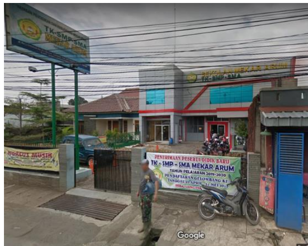
Gambar 2.19 Entrance SMA Mekar Arum

rendah dan entrance masuk lingkungan sekolah dbatasi dengan pagar besi yang tinggi.