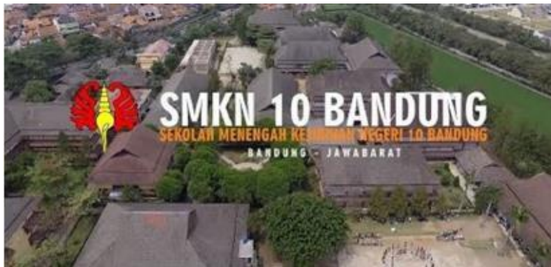
Gambar 2.2 Logo SMKN 10 Bandung

Sekolah Menengah Kejuruan Negeri 10 Bandung merupakan sekolah seni pertunjukan pertama di Jawa Barat. SMK N 10 Bandung berdiri di atas lahan \pm 55.000 \text{ m}^2 (5,5 Ha) dan memiliki berbagai macam jurusan seni didalamnya, seperti seni tari, padalangan, teater, musik dan karawitan.