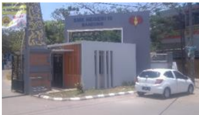
Gambar 2.8 Ruang Keamanan

Pada Lingkungan sekolah terdapat petugas keamanan yang didesain pada entrance lingkungan sekolah. Hal ini bertujuan agar pihak keamanan dapat mengawasi kegiatan siswa.