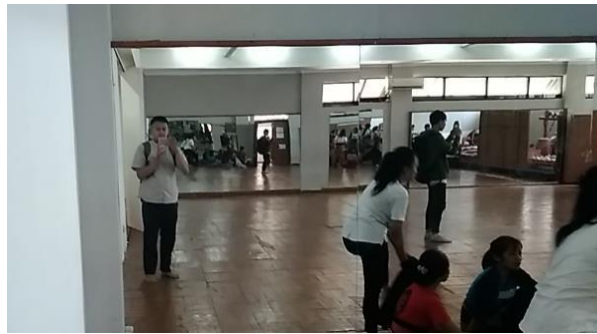
Gambar 2.10 Material Ruang Tari

ruangan dan menggunakan material lantai vinyl agar tidak licin ketika sedang melakukan kegiatan kesenian.