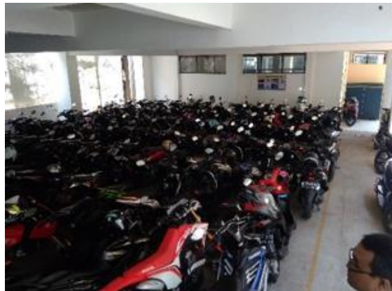
Gambar 2.17 Area Parkir

lingkungan sekolah dan yang ketiga parkir siswa dengan kapasitas parkir yang sudah ditentukan di area basement.