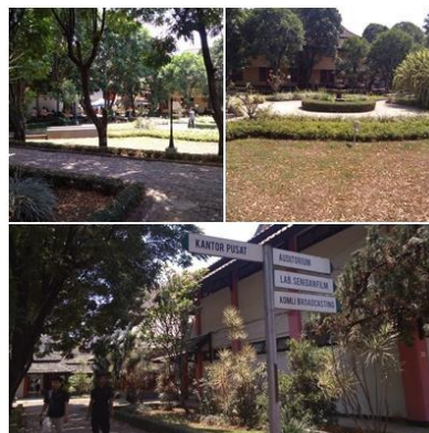
Gambar 2.12 Vegetasi

Vegetasi di lingkungan sekolah cukup banyak dan rindang dan di tata di setiap taman dan sirkulasi lingkungan sekolah.