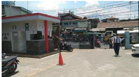
Gambar 2.18 Pos Keamanan

Petugas keamanan sekolah mekar arum diletakkan di area entrance dan gerbang masuk sekolah. Lingkungan sekolah mekar arum dibatasi dengan gerbang dan dijaga oleh keamanan sekolah.