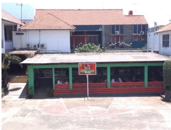
Gambar 2.16 Area Kantin

SMA Mekar Arum Bandung terdapat kantin dengan \pm 8 yang berada di area depan sekolah dekat gerbang masuk, penempatan kantin pada area depan sekolah bertujuan agar siswa dapat dipantau dan mudah dilihat apakah ada siswa yang pergi ke kantin ketika sedang berlangsungnya kegiatan kbm.