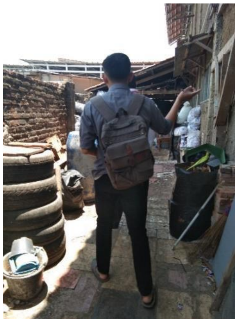
Gambar2.20 Area Limbah