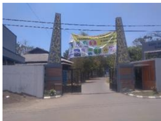
Gambar 2.9 Entrance

Entrance menuju ke dalam lingkungan sekolah ditandai dengan gerbang yang dijaga oleh pihak keamanan sekolah. Entrance SMK N 10 Bandung memiliki dua entrance, entrance pertama berada di depan lingkungan sekolah yang di jaga oleh kamanan dan entrance kedua ditandai dengan gapura kecil.