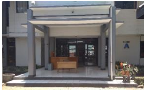
Gambar 2.5 Ruang Humas

Ruang humas merupakan ruang yang berhubungan dengan masyarakat yang memberi informasi dan yang berkomunikasi dengan pihak internal maupun eksternal.