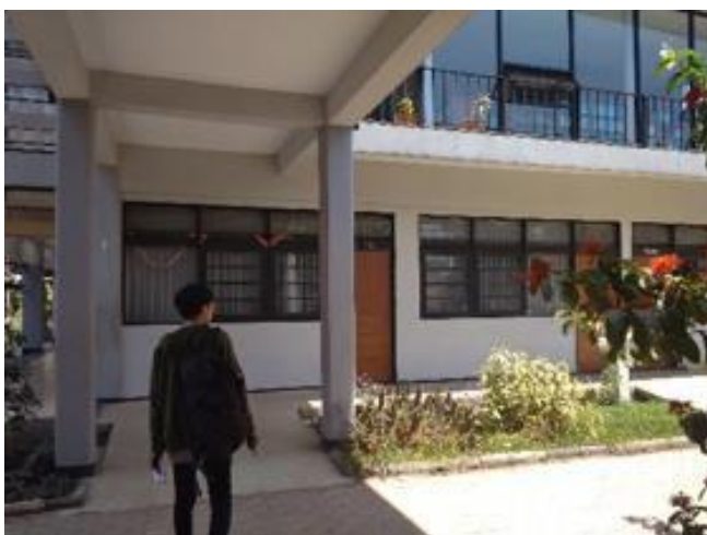
Gambar 2.7 Ruang UKS

Terdapat Ruang UKS yang dapat di gunakan untuk mendidik dan membina kebiasaan hidup yang sehat di lingkungan sekolah dengan memberikan pengajaran dan pelayanan kesehatan.