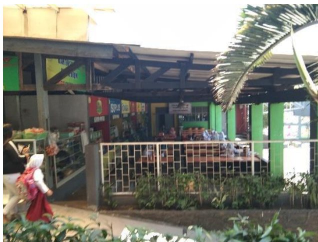
Gambar 2.21 Vegetasi Lingkungan SMA Mekar Arum

Vegetasi pada lingkungan sekolah mekar arum tidak terlalu banyak, lingkungan sekolah hanya memiliki tanaman tanaman berpot di sepanjang koridor.