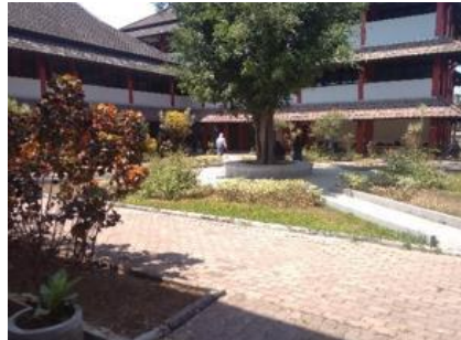
Gambar 2.11 Area Taman

Sekolah ini memiliki bentuk lansekap dengan desain taman bentuk melingkar dan terdapat pohon yang rindang ditengah taman, taman ini terdapat dua di lingkungan sekolah yang diletakkan menyebar dan digunakan untuk menunggu para tamu dan digunakan untuk ruang interaksi para siswa.