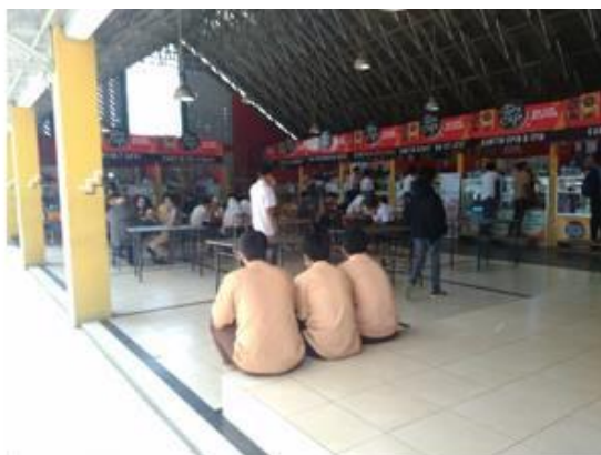
Gambar 2.6 Kantin

SMK N 10 Bandung terdapat kantin dengan 10 retail yang dapat di manfaatkan untuk siswa istirahat, makan dan dapat digunakan untuk para tamu dan orang tua/wali siswa menunggu.