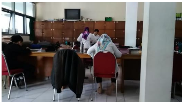
Gambar 2.15 Ruangan Humas SMA Mekar Arum