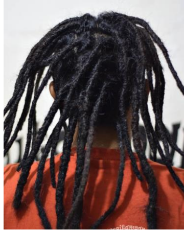
Gambar II.8 Freeform Dreadlocks