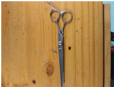
Gambar II.21 Gunting