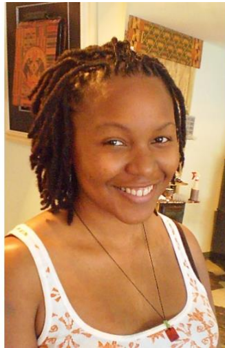
Gambar II.7 Natural Dreadlocks

Rambut gimbal jenis ini merupakan tipe yang mana rambut aslinya lebih mudah saat dijadikan gimbal. Hanya dengan memutar-mutar saja, rambut akan menjadi gimbal dengan sendirinya.