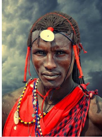
Gambar II.1 Rambut Gimbal Suku Maasai