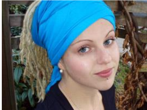
Gambar II.12 Penggunaan ikat kepala

menjaga bentuk rambut dan juga menghindarkan rambut menyentuh bagian wajah.