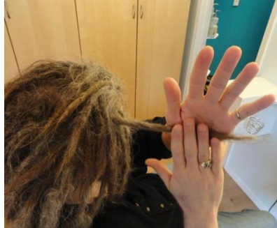
Gambar II.10 Repairing