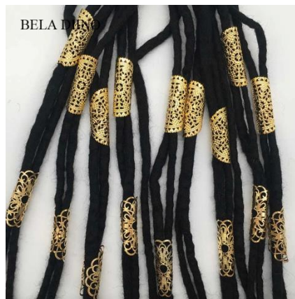
Gambar II.13 Aksesoris rambut gimbal

Perihal kesehatan rambut gimbal sendiri, langkah-langkah di atas merupakan hal pokok yang harus dilakukan para pemilik rambut gimbal agar rambut tidak mudah rusak dan terhindar dari penyakit seperti ketombe dan wabah kutu rambut. Sedangkan untuk menjaga rambut tetap memiliki nilai estetis, menambahkan aksesoris pada rambut dapat dijadikan sebuah alternatif. Selain itu pakaian yang rapi juga memberikan kesan bersih pada seseorang yang berambut gimbal. Saat rambut gimbal terjaga dalam aspek kesehatan, bentuk dan estetisnya, maka hal ini akan membawa pandangan yang baik pada masyarakat.