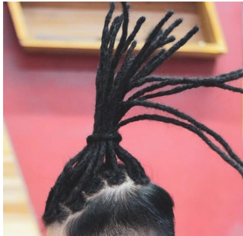
Gambar II.9 Pattern Dreadlocks