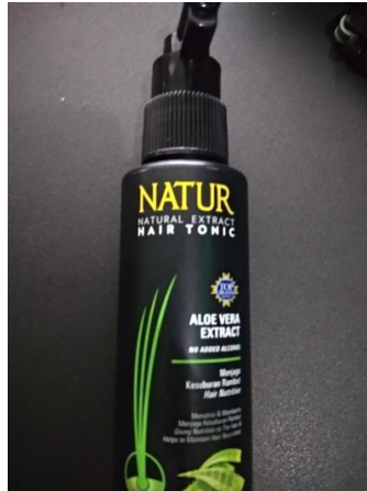
Gambar II.15 Hair spray rambut Sumber : Dokumentasi Pribadi (30 Oktober 2019)