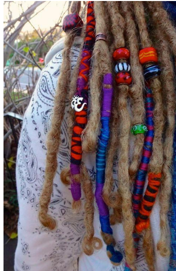
Gambar II.14 Rambut gimbal dengan aksesoris