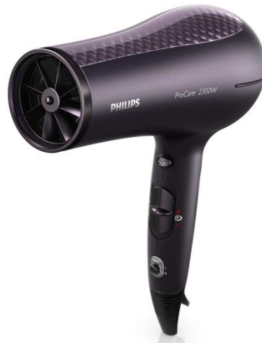
Gambar II.18 Hairdryer

Hairdryer atau pengering rambut berfungsi untuk mengeringkan rambut gimbal setelah dibilas agar tidak lembab. Selain menimbulkan bau yang tidak sedap, rambut gimbal yang lembab juga menyebabkan kotoran dan debu menempel dan mengendap menjadi ketombe. Namun, pada pelaksanaannya pengeringan rambut menggunakan hairdryer tidak diperkenankan dalam waktu yang lama, karena dapat membuat rambut menjadi kering, rapuh dan rusak.