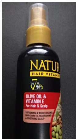
Gambar II.16 Hair spray kulit kepala Sumber : Dokumentasi Pribadi (30 Oktober 2019)