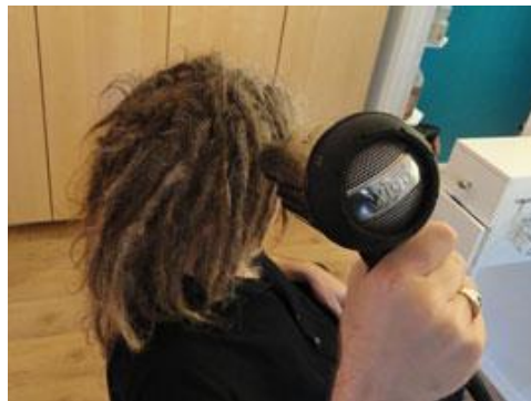
Gambar II.11 Pengeringan Rambut