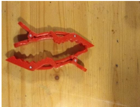
Gambar II.20 Jepit

Kegunaan jepit untuk rambut gimbal biasanya untuk memisahkan batangan rambut gimbal dari rambut yang belum digimbal