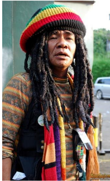
Gambar II.5 Classic Dreads

Jenis ini memiliki ukuran rambut yang tebal. Biasanya dibiarkan terurai begitu saja. Kelebihan dari rambut gimbal jenis ini yaitu pertumbuhan rambut baru tidak akan mengganggu tampilan atau bentuk dari rambut gimbal itu sendiri.