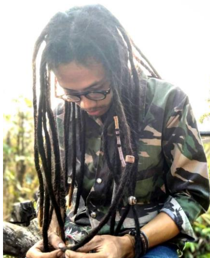
Gambar II.4 Skinny Dreads

Jenis rambut gimbal ini merupakan jenis rambut gimbal yang biasanya memiliki ukuran yang kecil. Jenis rambut gimbal ini biasanya ditampilkan dengan diikat atau diurai begitu saja.