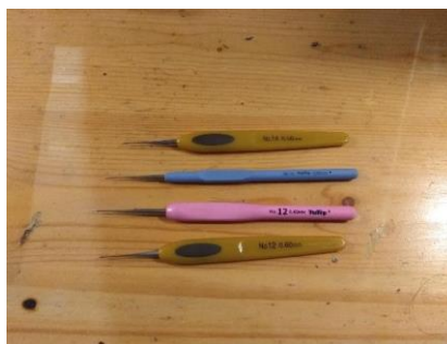
Gambar II.17 Jarum Crochet Sumber: Dokumentasi Pribadi (21 April 2019)