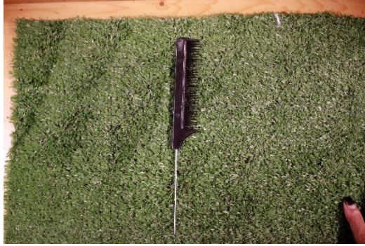
Gambar II.19 Sisir