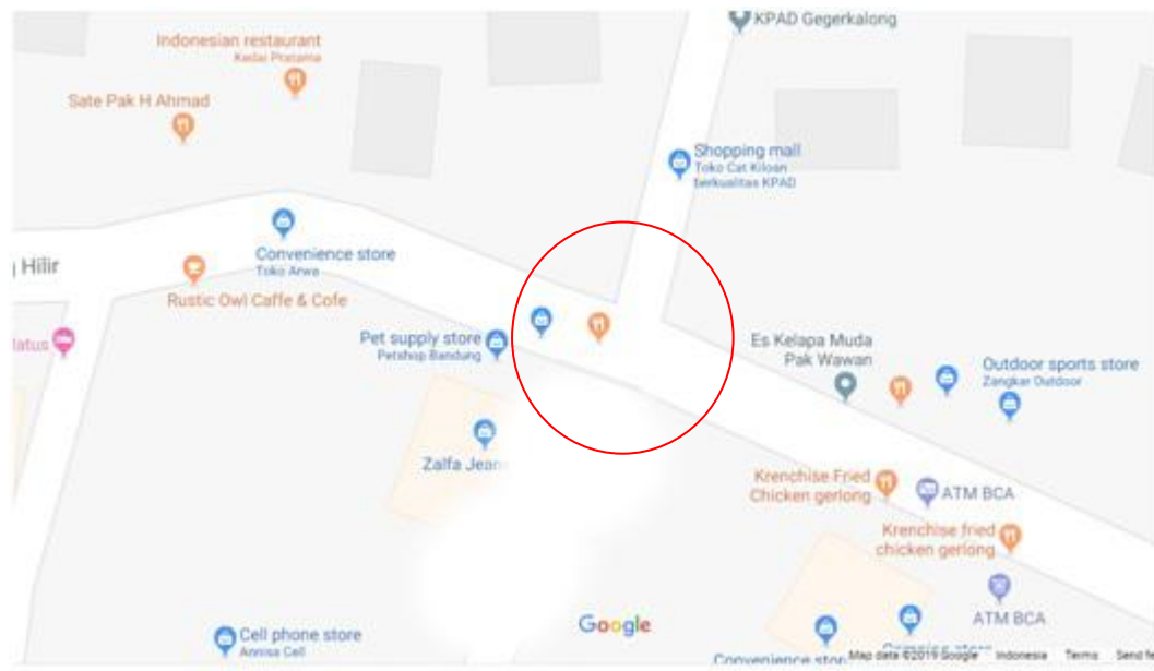
Gambar 3.1 Peta lokasi studi kasus

Lokasi penelitian dilakukan di persimpangan Jalan Gegerkalong Hilir dan Jalan Pak Gatot Raya, Kelurahan Sukarasa, Kecamatan Sukasari, Kota Bandung Jawa Barat seperti pada gambar 3.1. Lokasi survey berada pada lingkaran merah.